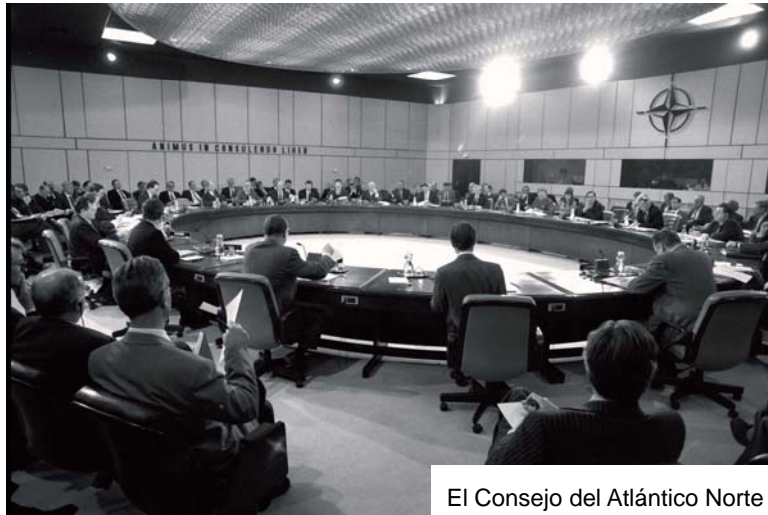
El Consejo del Atlántico Norte