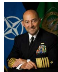
SACEUR Adm US Navy James Stavidis