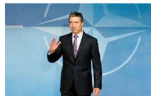
Mr Anders Fogh Rasmussen