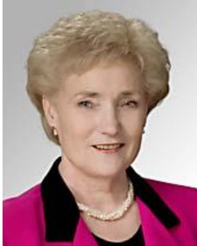
Hon. Erna Hennicot-Schoepges Ex-Presidente del Parlamento (former) Luxemburgo