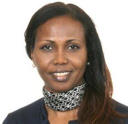
Hon. Amiira Neff Presidente de Alliance Globale MGF Suiza