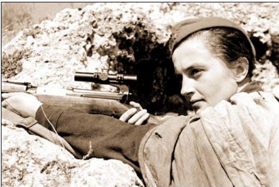
Figura 1: La francotiradora del Ejército Rojo Lyudmila Pavlichenko

Ejemplos de mujeres guerreras hay, aunque no son muy numerosos. Así podríamos hablar desde Juana de Arco a las mujeres del Ejército Rojo soviético 2 , pasando por las mujeres guerreras íberas o la increíble Boudica 3 , la reina guerrera de Britania.