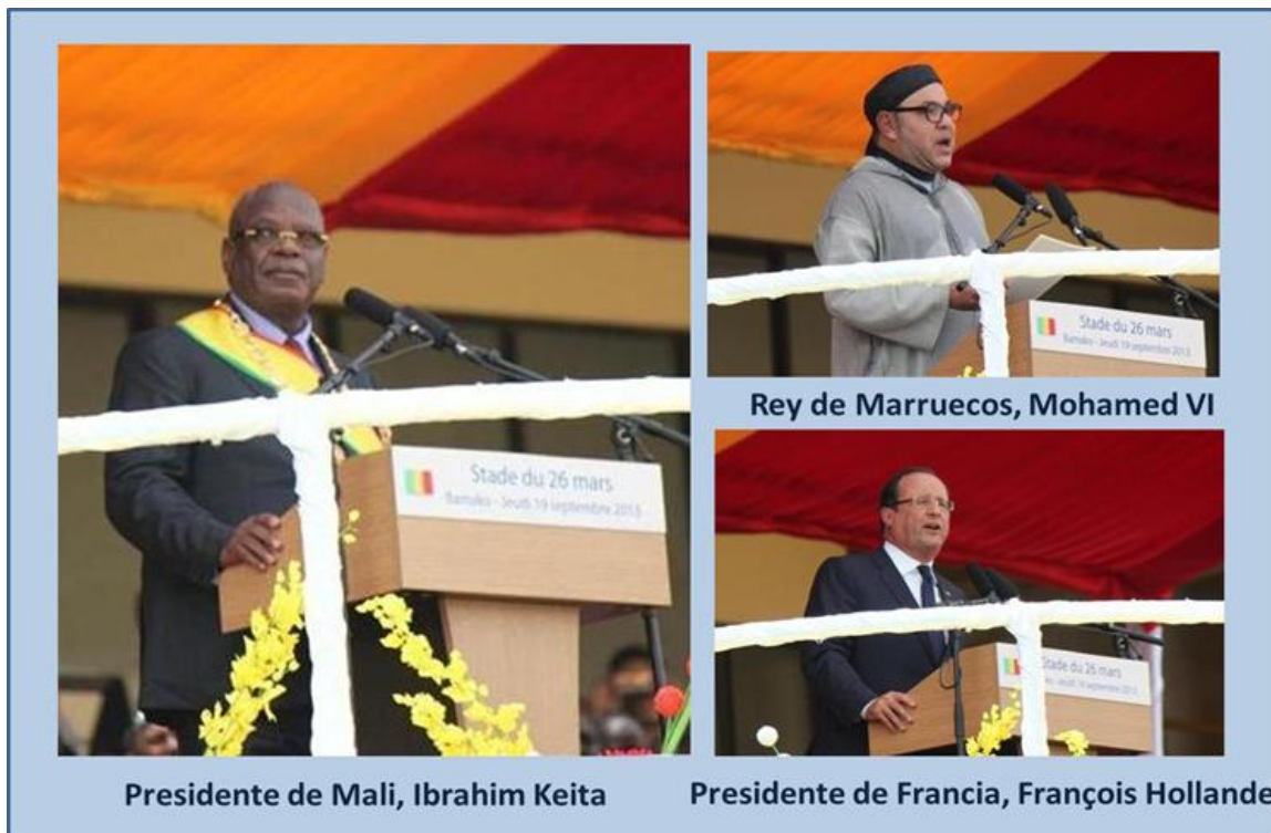
Investidura pública del presidente Keita. Bamako, 19 de septiembre de 2013

Pero, sin duda, la concurrencia más significativa fue la del presidente de Francia, François Hollande. Su apoyo constante a la resolución de la crisis ante la comunidad internacional, y su decisión, en enero de 2013, de responder con una intervención militar a la petición de las autoridades de la transición, han convertido a Francia en el principal artífice y valedor de la estabilidad actual del país ante gran parte del poder político y de la sociedad maliense. La operación Serval – que aún mantiene 3.200 soldados galos en Mali– permitió la recuperación de la integridad territorial y, en gran medida, la celebración del proceso electoral que concluyó con la restauración del orden constitucional.