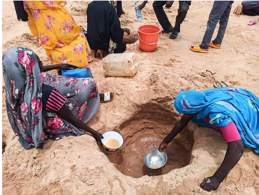
Figura 2. Refugiados sudaneses en Chad.

El polígono regional de inestabilidad que se retroalimenta se amplía con el concurso del país más joven del mundo. Sudán del Sur también sufre la avalancha de refugiados y retornados.