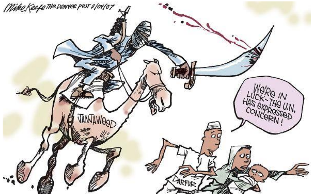
Figura 3. Janjaweed still Attacks. Autor: Mike Keefe. 11/4/2007

Las perspectivas de futuro no se presentan halagüeñas para la región. Sirva de ejemplo el caso de Chad. Una victoria de Hemedti haría peligrar el papel supuestamente transicional del presidente chadiano Déby, pero también su derrota, puesto que los chadianos árabes podrían intentar tomar el poder. Y en ningún caso parece real un escenario en el que Hemedti renuncie a Darfur, cuyo oro es el sustento de su fuerza.