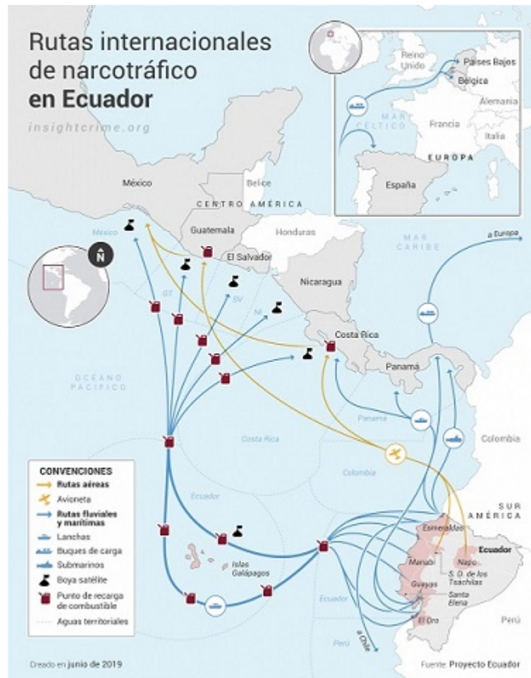
Figura 2. Rutas internacionales del narcotráfico en Ecuador.

Este cambio en la dinámica regional del narcotráfico ha contribuido al crecimiento del comercio ilícito de drogas en Ecuador, convirtiéndolo en un actor relevante en la cadena de producción y distribución internacional. Los estupefacientes, provenientes de países vecinos, se canalizan desde los puertos ecuatorianos hacia destinos como Guatemala o México, donde se someten a procesos de tratamiento antes de su envío a Estados Unidos.