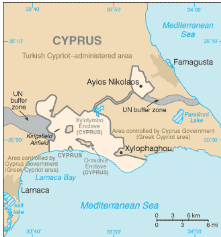
Fig.3: Base Soberana de Dhekelia.

Dhekelia es la Base Soberana Oriental que se encuentra entre Larnaca y Farmagusta y cerca del límite con la República Turca del Norte y por tanto, de la zona de contención administrada por Naciones Unidas.