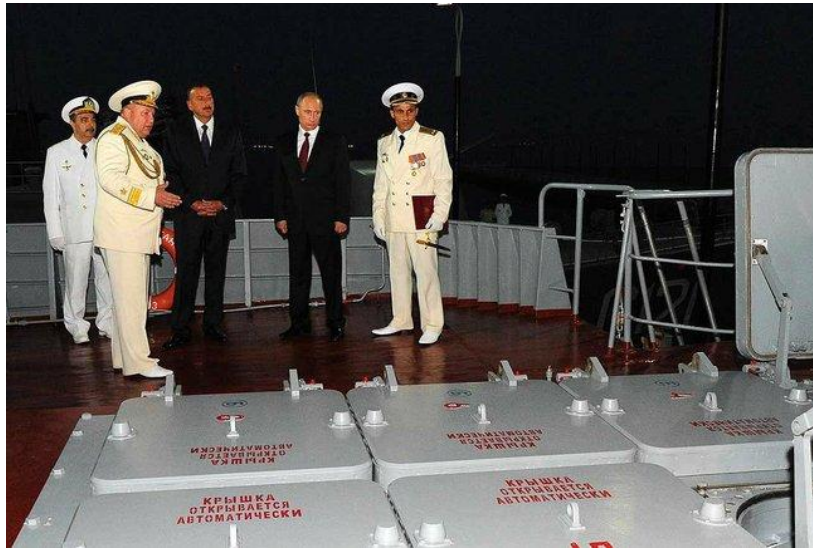
Visita de Putin y Aliyev a los buques rusos surtos en el puerto de Bakú

Precisamente pocos días después de la visita de Putin a Azerbaiyán, y sin duda influido por ella, el Presidente Sargsian anunció en Moscú que Armenia se uniría a la Unión Aduanera de Rusia, Bielorrusia y Kazajstán. Eso representaba en la práctica la renuncia armenia a suscribir el Acuerdo de Asociación y Libre Comercio con la Unión Europea, cuya firma estaba prevista para la Cumbre de la Asociación Oriental a celebrar en Vilnius (Lituania) en noviembre 7 .