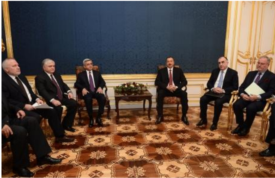
Imagen de la reunión de los Presidentes Aliyev y Sargsian en Viena

En la subsiguiente Cumbre Ministerial de Kiev, ensombrecida por los incidentes por el rechazo ucraniano a la firma del Acuerdo de Asociación con la UE, los Ministros de Exteriores de Azerbaiyán y Armenia reiteraron su propósito de continuar las negociaciones, ya que “los habitantes de la región esperan y merecen la resolución de un conflicto que ha durado ya demasiado tiempo” , y anunciaron que se reunirían de nuevo a principios de 2014 bajo los auspicios de la OSCE 4 .