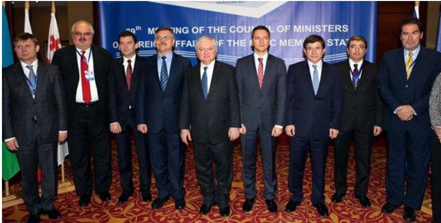
Reunión de Ministros de AAEE del BSCE en Ereván, con Davutoglu (3º por la derecha) y Nalbandian (centro)

en práctica los protocolos” 12 , haciendo alusión a los acuerdos alcanzados en Zúrich en 2009, que nunca ha sido ratificados por los respectivos Parlamentos.