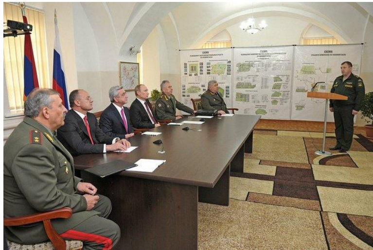
Putin y Sargsian durante su visita a Gyumri

Esas fuerzas se ubican principalmente en la 102 Base de Gyumri, al noroeste de Armenia, pero se extienden por diversas instalaciones del país, bajo la etiqueta de grupo de fuerzas regionales de la OTSC. Además, Rusia suministra armamento a Ereván a precio de coste, a diferencia de las compras azeríes que se realizan a precio de mercado 9 .