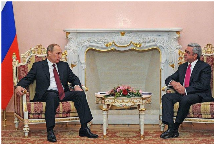
Imagen de la reunión de diciembre de Putin y Sargsian en Ereván

Frente a ese masivo peso ruso en la economía de Armenia la presencia de la UE resulta nimia. Pero si es grande la dependencia económica, la dependencia en el ámbito de la seguridad es total. La extensión de los acuerdos bilaterales en 2010 estableció que las fuerzas rusas estacionadas en Armenia responderían a cualquier agresión procedente de Georgia o Azerbaiyán, conjuntamente con las fuerzas armenias.