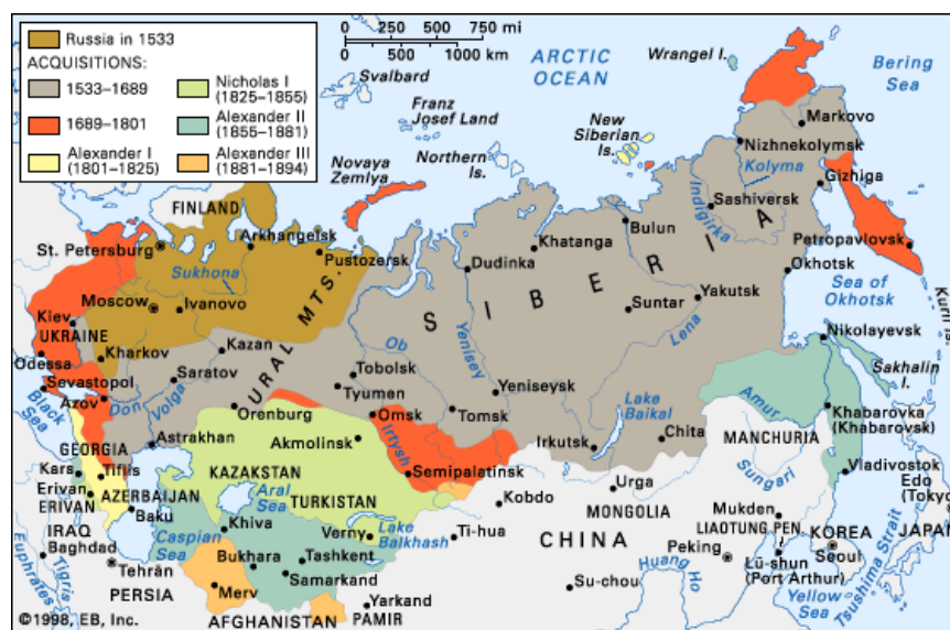
Figura 2: Expansión rusa hasta el siglo XIX.

Una de las características que el autor nos señala es la «gran epopeya rusa» 21 , que supuso un proceso de expansión territorial ininterrumpido desde el siglo XVI hasta el final de la Segunda Guerra Mundial, cuando llegó a su máxima extensión.