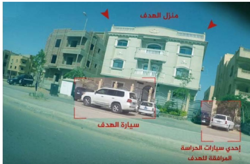
Figura 4. Imagen difundida por el grupo tras el atentado fallido contra el fiscal Abdel Aziz.

justificado por la actitud de los jueces a los que acusan de sentenciar a muerte o a cadena perpetua a miles de inocentes, todo ello a instancias de los militares 52 .