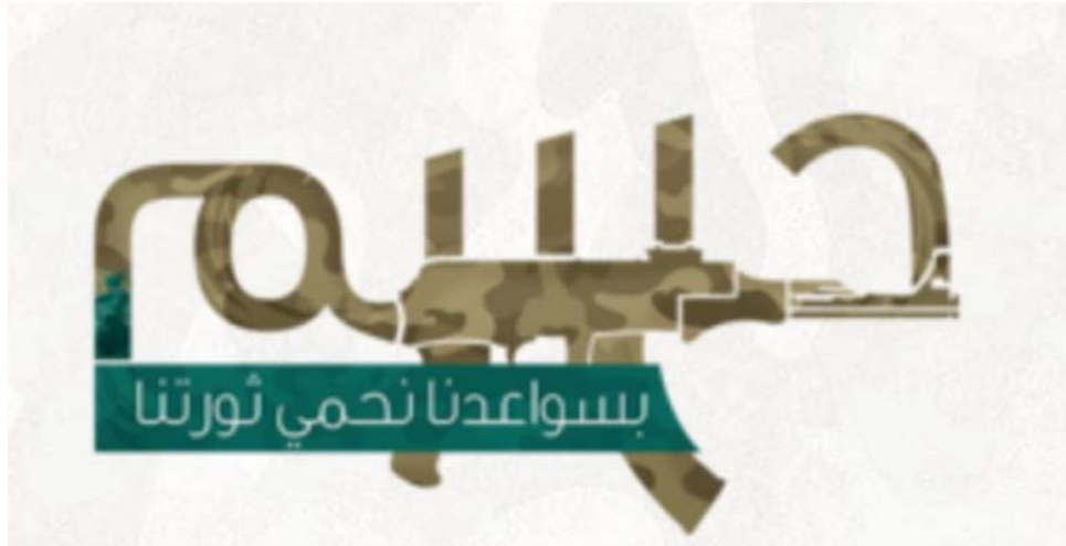
Figura 1. Logo empleado por el Movimiento Hasam.

Una de estas últimas es Harakat Sawa'd Misr (brazo del Movimiento de Egipto) también conocido como movimiento Hasam 12 , vocablo que puede ser traducido como «decisión» o «determinación».