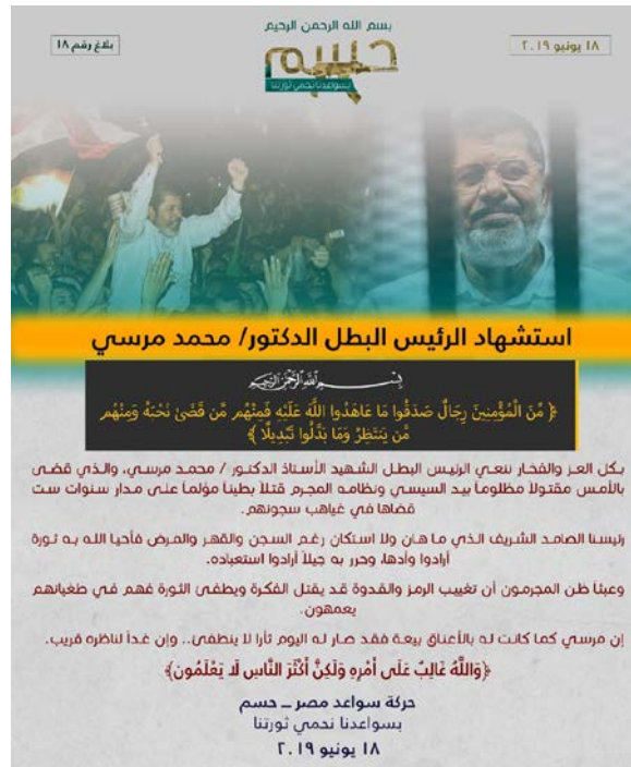
Figura 2. Comunicado difundido por el grupo con ocasión del fallecimiento de Mohamed Morsi.