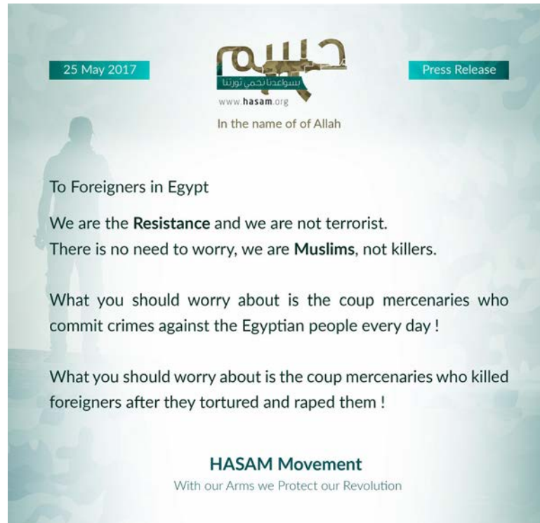
Figura 5. El 24 de mayo de 2017, la embajada de EE. UU. en El Cairo emitió un mensaje en el que advertía de un posible atentado del movimiento Hasam. Poco después el grupo difundió un comunicado a los extranjeros en Egipto, diciendo que Hasam es un movimiento de «resistencia» y no un «movimiento terrorista». Fuente.

https://twitter.com/search?l=&q=HASAM%20from%3AMENASTREAM&src=typd