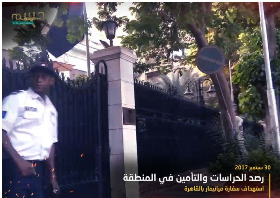
Figura 3. Imagen de la preparación del atentado contra la embajada de Myanmar. Fuente.

El grupo realizó un ataque contra una legación diplomática extranjera en octubre de 2017. La detonación del artefacto explosivo afectó a la sede de la embajada de Myanmar en El Cairo. El alcance de la bomba fue reducido y el Ministerio del Interior de Egipto informó de que los residentes pensaron que la explosión era consecuencia de una conducción de gas en mal estado 46 .