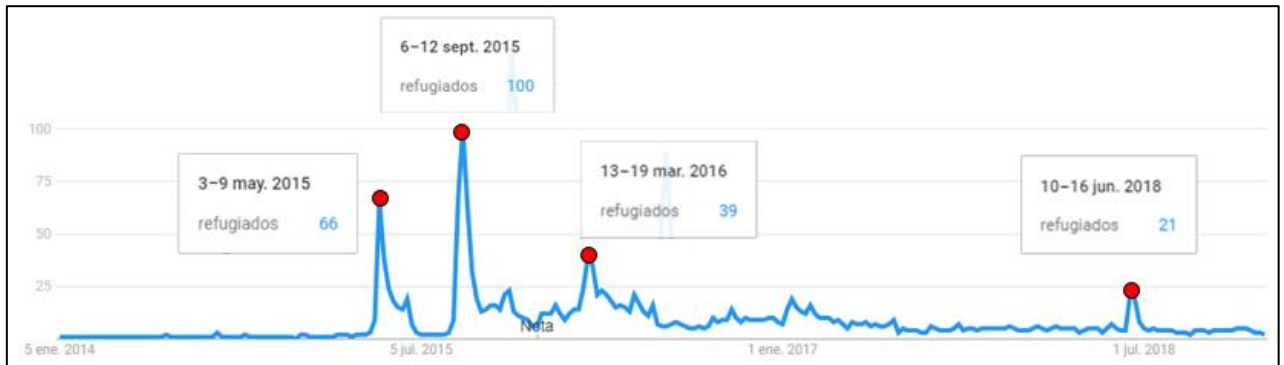
Figura 2. Recurrencia de la palabra «refugiados».

En la gráfica se distinguen cuatro picos puntuales asociados a los siguientes acontecimientos: