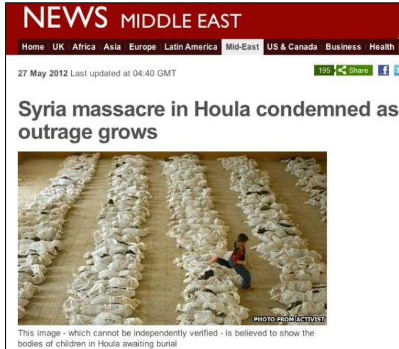
Figura 1. Foto publicada por la BBC sobre la masacre en Houla 10 .

En la fotografía (publicada por la BBC el 27 de mayo de 2012) observamos un pie de foto en el que se indica: «Esta imagen —que no puede ser verificada de manera independiente— se cree que puede mostrar los cuerpos de los niños asesinados en Houla a la espera de su sepultura».