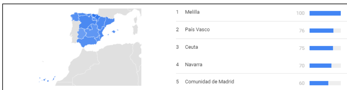
Figura 4. Recurrencia de la palabra «Siria» por regiones de España 34 .

Para analizar la relación del interés con los conceptos de proximidad y alarmismo, nos gustaría centrarnos en el siguiente gráfico que muestra el porcentaje de recurrencia de la búsqueda web «Siria» en las diferentes regiones de España entre enero de 2011 y enero de 2019.