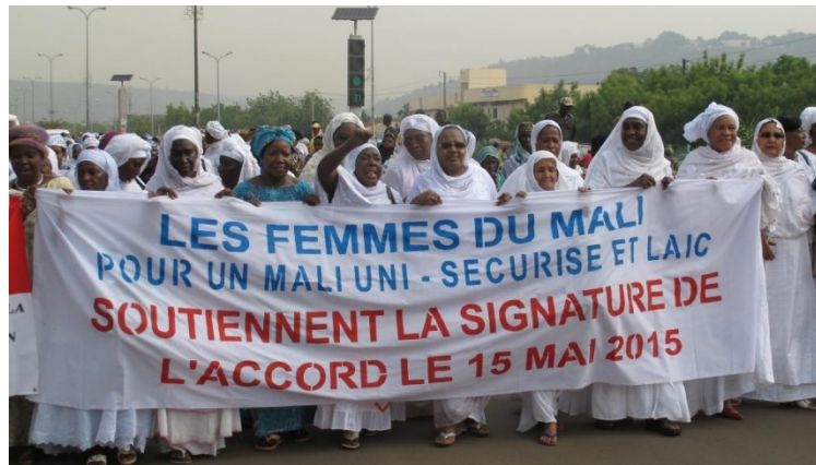
Figura 3. Manifestación de mujeres en Bamako en defensa del Acuerdo.

consultas regulares con las mujeres y jóvenes de Kidal 56 . En general, según Toure Omou, aunque apenas representadas en las negociaciones finales, las mujeres fueron el grupo más activo de la sociedad civil al comienzo de la crisis, movilizándose individual y colectivamente a través de manifestaciones, publicación de declaraciones, e iniciativas con diferentes autoridades (Figura 3) 57 .