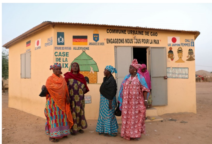
Figura 4. Mujeres enfrente de la «Cabaña de Paz» de Gao.

Esto demuestra la determinación y la actitud de colaboración de muchas de ellas, ilustrados aún más por su «capacidad de cooperar tendiendo puentes entre distintos grupos», como sugiere el CFR 60 , en la «Cabaña de Paz» de Gao. Allí, mujeres de diferentes opiniones y grupos étnicos, incluidas tuaregs y fulanis, se reúnen regularmente para hablar sobre temas relacionados con la cohesión social y la convivencia o los derechos de las mujeres, pero también para hacer crecer sus tan necesitados negocios 61 (Figura 4). De manera similar, desde 2017, mujeres de diferentes partes de Malí se reúnen en sentadas ( assises des femmes pour la paix ) para demostrar que pueden promover el diálogo social y la implementación del Acuerdo de Bamako 62 .