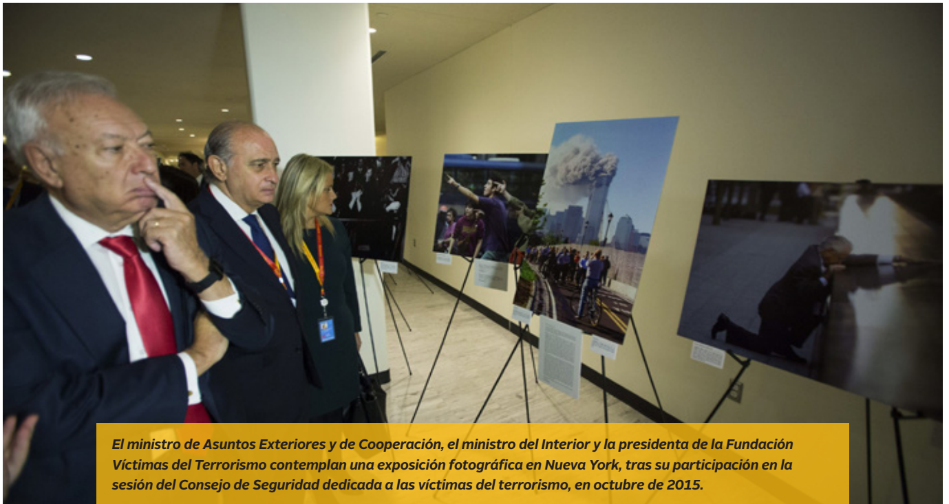
El ministro de Asuntos Exteriores y de Cooperación, el ministro del Interior y la presidenta de la Fundación Víctimas del Terrorismo contemplan una exposición fotográfica en Nueva York, tras su participación en la sesión del Consejo de Seguridad dedicada a las víctimas del terrorismo, en octubre de 2015.

permite inspeccionar y, en su caso, tomar medidas contra los buques que se dediquen al tráfico de migrantes y la trata de personas en el Mediterráneo frente a las costas de Libia.