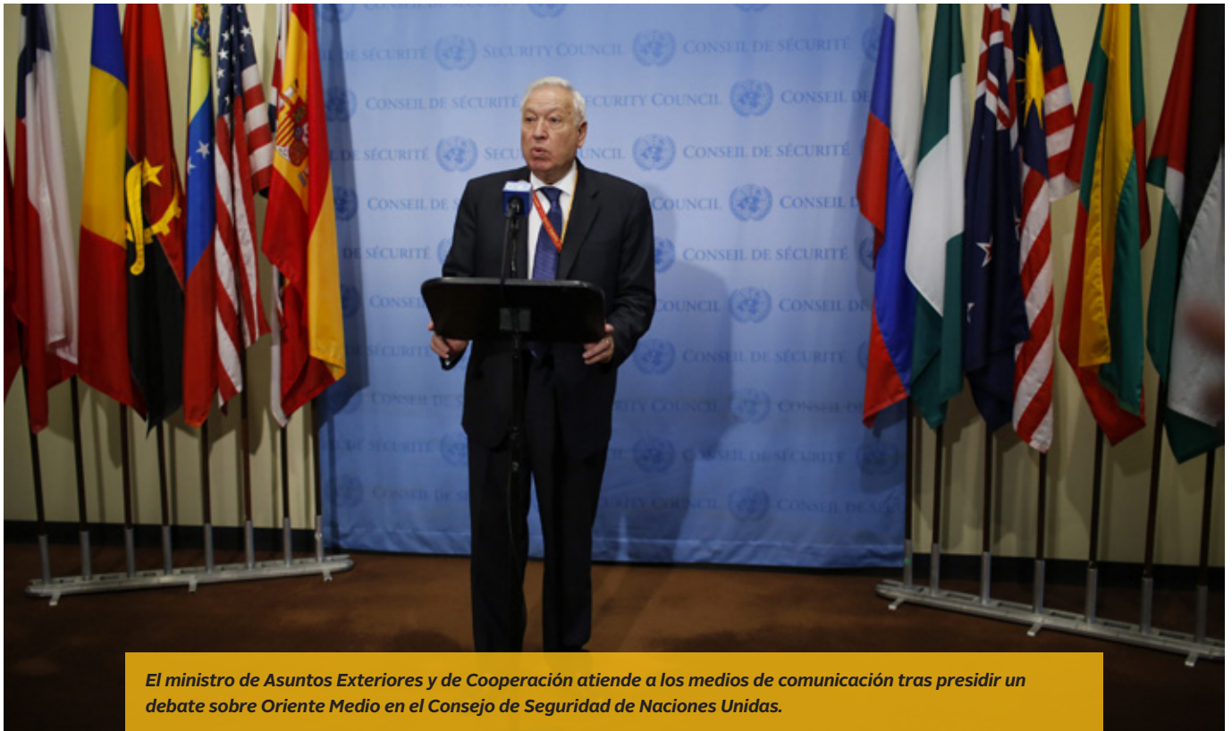
El ministro de Asuntos Exteriores y de Cooperación atiende a los medios de comunicación tras presidir un debate sobre Oriente Medio en el Consejo de Seguridad de Naciones Unidas.