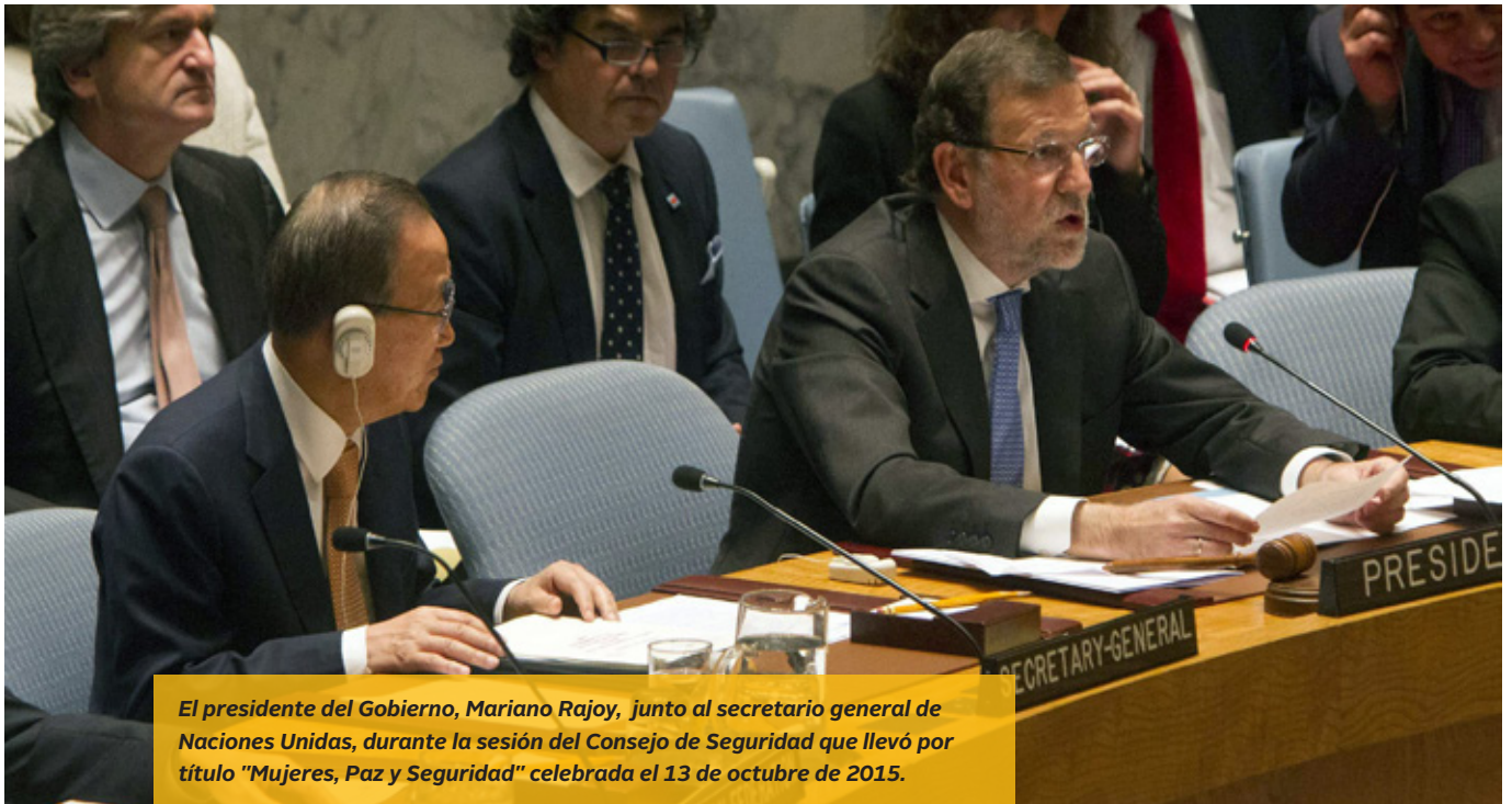
El presidente del Gobierno, Mariano Rajoy, junto al secretario general de Naciones Unidas, durante la sesión del Consejo de Seguridad que llevó por título "Mujeres, Paz y Seguridad" celebrada el 13 de octubre de 2015.

del Consejo para poner fin o evitar actos de genocidio, crímenes de lesa humanidad o crímenes de guerra.