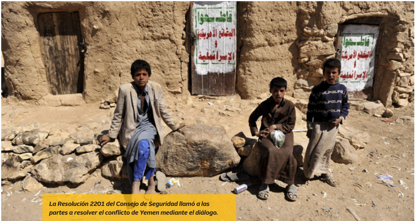
La Resolución 2201 del Consejo de Seguridad llamó a las partes a resolver el conflicto de Yemen mediante el diálogo.

tomar nuevas medidas unilaterales que puedan socavar la transición política en Yemen y que cumplan las obligaciones que les incumben en virtud del derecho internacional. España contribuyó a fortalecer el lenguaje de esta resolución sobre el acceso rápido, seguro y sin obstáculos de los agentes humanitarios.