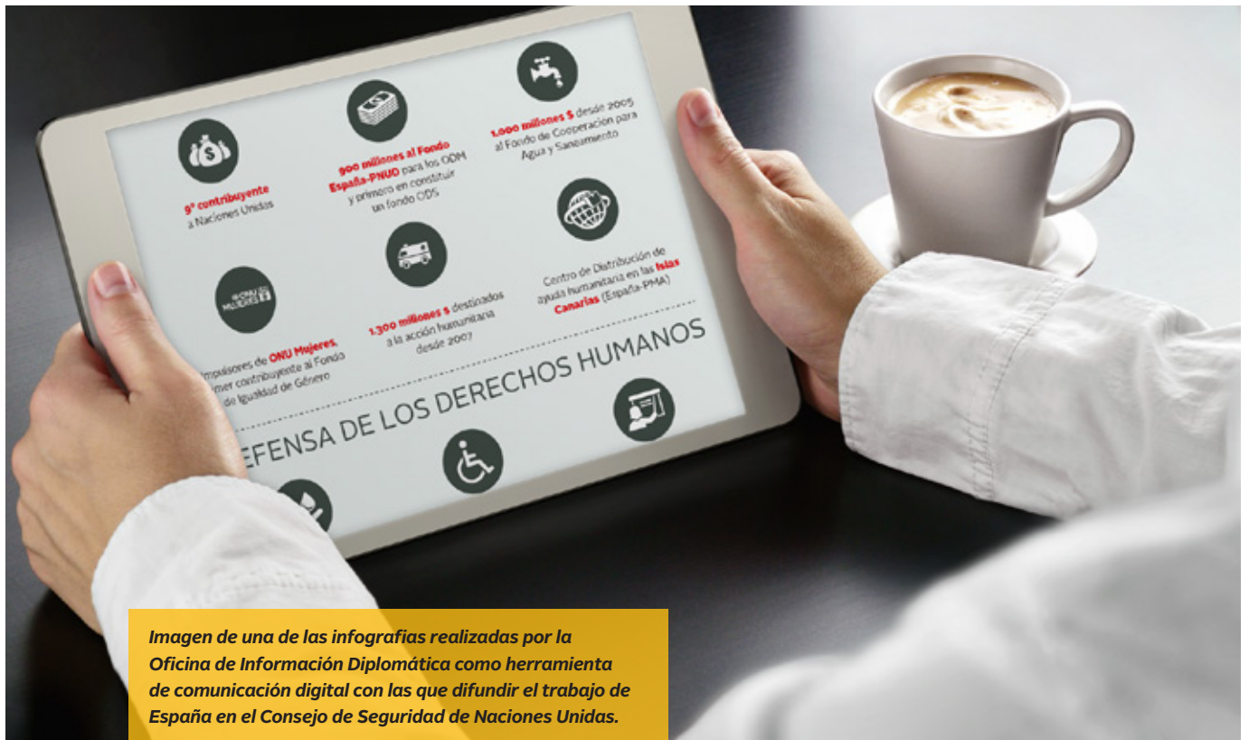
Imagen de una de las infografías realizadas por la Oficina de Información Diplomática como herramienta de comunicación digital con las que difundir el trabajo de España en el Consejo de Seguridad de Naciones Unidas.

revistas especializadas, universidades y ONGs españolas para presentar las prioridades de España y hacer balance del mes de presidencia española del Consejo de Seguridad.