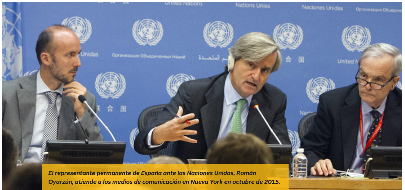
El representante permanente de España ante las Naciones Unidas, Román Oyarzún, atiende a los medios de comunicación en Nueva York en octubre de 2015.

Madrid y extendido ese ejercicio a otras capitales; y hemos dedicado especial empeño a la dimensión europea, informando regularmente a los socios en Nueva York y en Bruselas y recabando su opinión con regularidad en relación con los temas centrales de la Política Exterior y de Seguridad Común (PESC), de acuerdo con lo previsto en el artículo 34 del Tratado de la Unión Europea.