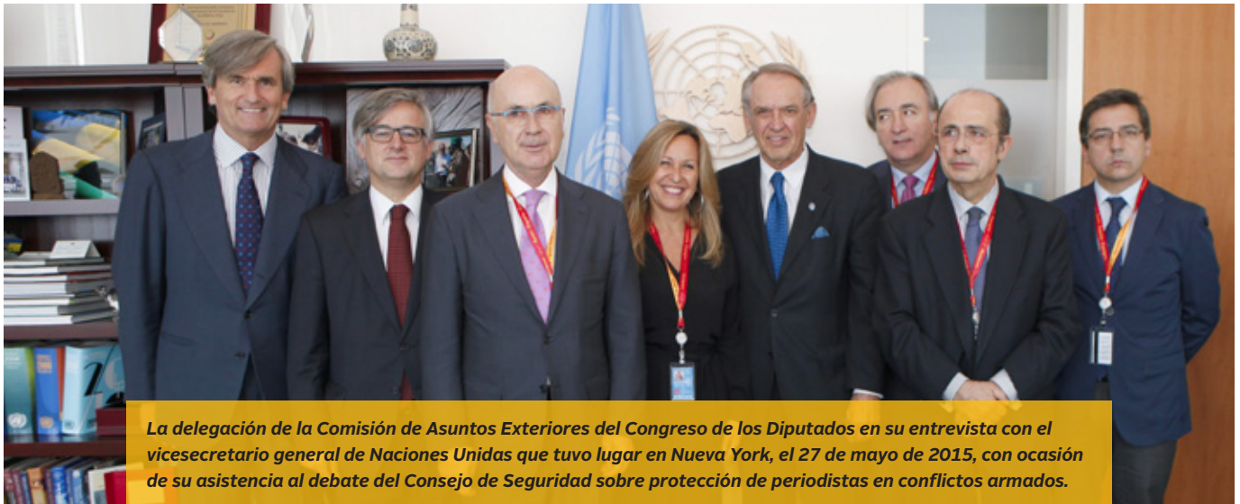
La delegación de la Comisión de Asuntos Exteriores del Congreso de los Diputados en su entrevista con el vicesecretario general de Naciones Unidas que tuvo lugar en Nueva York, el 27 de mayo de 2015, con ocasión de su asistencia al debate del Consejo de Seguridad sobre protección de periodistas en conflictos armados.

nuevos retos, como el impacto y el papel de las mujeres en la lucha contra el terrorismo; y consagra el compromiso renovado del sistema de NNUU y del Consejo con la agenda de MPS.