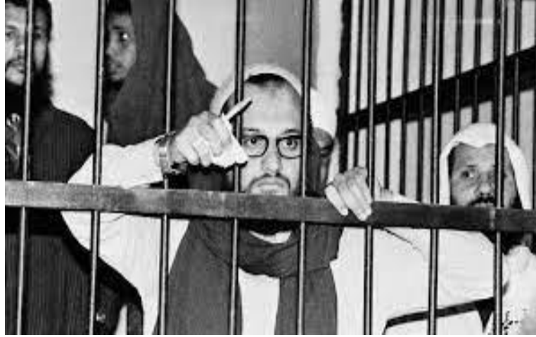
Ayman al-Zawahiri, entre las rejas en un tribunal egipcio durante su juicio en 1982, acusado del asesinato del presidente de Egipto Anwar al-Sadat.

mantenimiento de la fuerza, son necesarias para alcanzar la «victoria del islam», siendo así transmitido por las organizaciones yihadistas. Solo desde la fe los «enemigos del islam» serán derrotados.