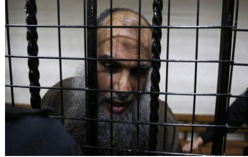
Imagen del clérigo Abu Qutada en Ammán (Jordania)