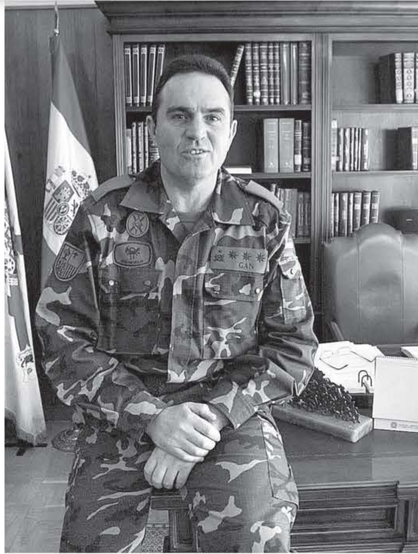
El general Gan Pampols en su época al frente de América 66.

Ministerio del Interior, en contacto con todos los cuerpos y fuerzas de seguridad, es de cuatro sobre cinco. Es decir, efectivamente, existe la percepción de riesgo. Si no, no existiría ese nivel de alerta. Cualquier gran con-