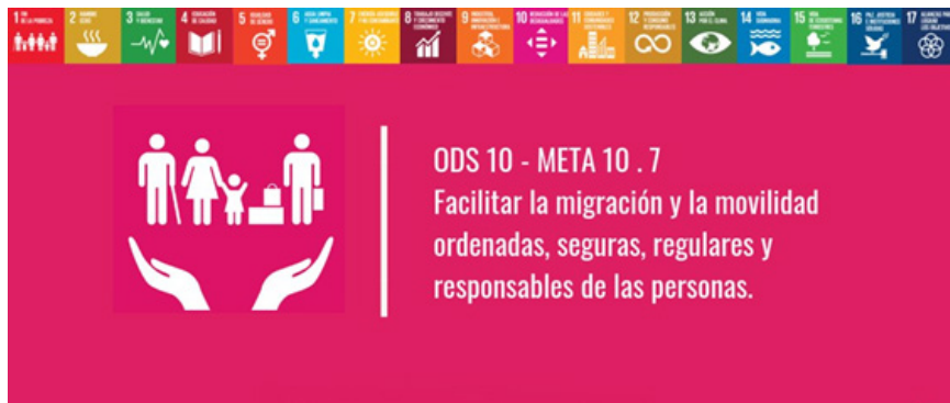
Figura n.º 1. Meta 10.7 Agenda 2030 de Naciones Unidas.

migración, ya que puede promover la colaboración internacional sobre el tema.