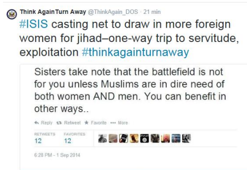
Figura 3: ejemplo de un comentario publicado por el gobierno norteamericano en su perfil de Twitter Think Again Turn Away sobre el viaje a la servidumbre y explotación, solo de ida, que supone unirse a EI.