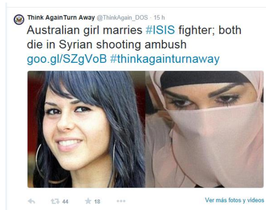
Figura 2: ejemplo de un comentario publicado por el gobierno norteamericano en su perfil de Twitter Think Again Turn Away sobre una chica australiana que se casó con un combatiente de EI y ambos fallecieron.