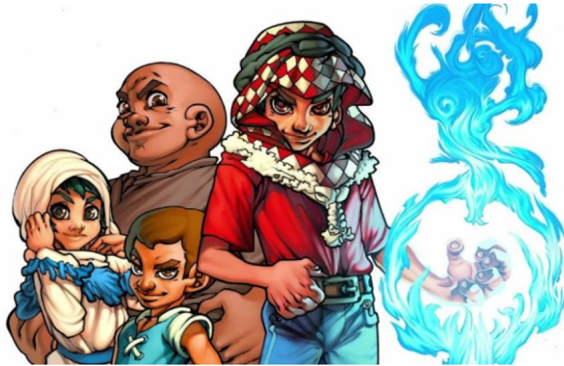
Imagen: Algunos personajes creados por Bakhit.