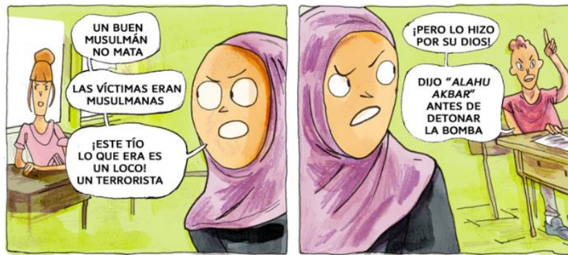
Imagen: Dos viñetas de Las afueras.