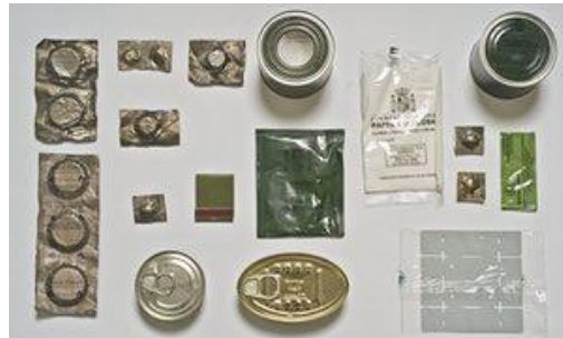
Algunos ejemplos de MRE de Francia, UK y España https://www.theguardian.com/lifeandstyle/2014/feb/18/eat-of-battle-worlds-armies-fed

Con respecto al componente generacional, hay que tener en cuenta que los hábitos alimenticios cambian con el tiempo, sobre todo con el fenómeno de la globalización. Por ejemplo, los antiguos soldados americanos solicitaban que en sus MRE se introdujeran estofados, mientras que los soldados actuales piden tacos, burritos o ramen 38 , el cocido japonés que también se está poniendo de moda en España 39 .