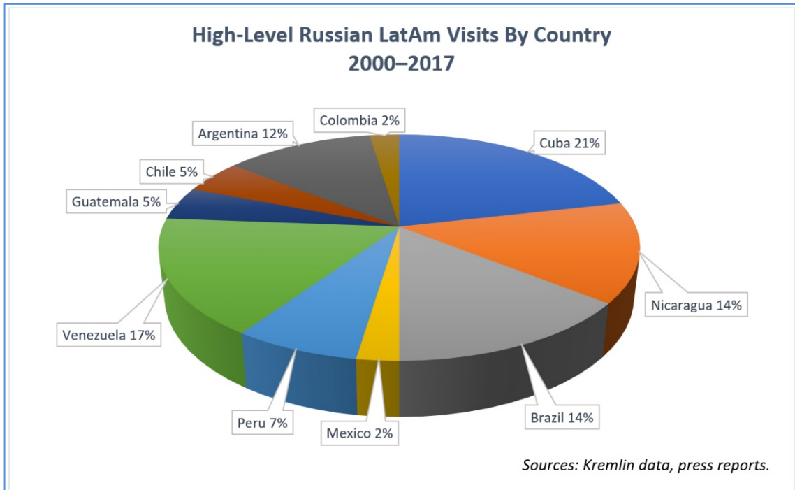
Figura 3: Visitas de alto nivel de Rusia a países latinoamericanos.

En el caso particular de Brasil, el nivel de colaboración bilateral se elevó a «colaboración estratégica» ya en 1997 y en 2009 alcanzó el nivel multilateral con la institucionalización del grupo BRIC (Brasil, Rusia, India y China, a los que luego se sumaría Sudáfrica, formando los BRICS) y la decisión de realizar una cumbre anual, lo que fomenta las relaciones entre sus integrantes. También la participación de Rusia, Argentina, México, y Brasil en el G-20 facilita el diálogo de Rusia con estos países.