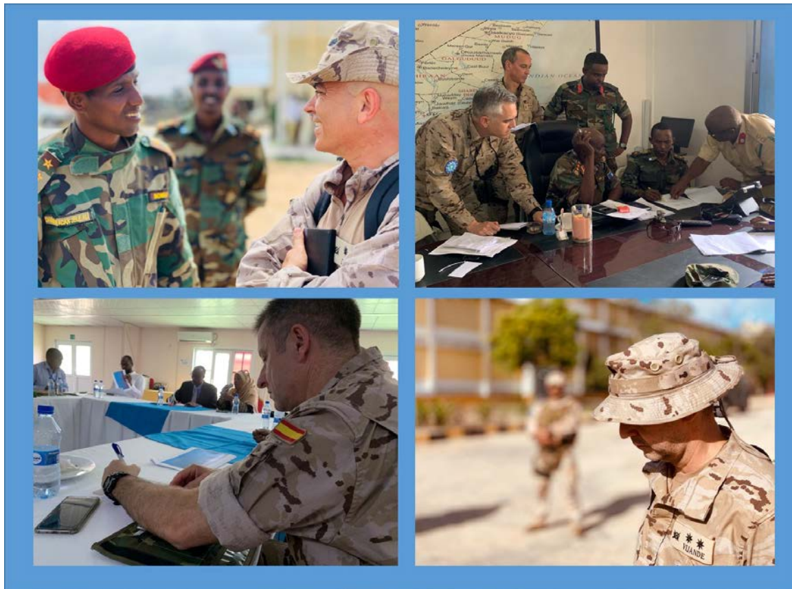
Figura 3. Equipo de Asesoramiento EUTM Somalia.

(combustible y comida) de Estados Unidos al ejército nacional 19 . Unos condicionantes que Somalia debe revertir en medio del desafío operacional que ha supuesto «construir el Ejército Nacional de Somalia durante la guerra, en ausencia de un proceso de paz y hasta hace muy poco (2017), sin una arquitectura, estrategia y estructura acordadas de fuerzas de seguridad nacional», señala el profesor Paul Williams 20 .