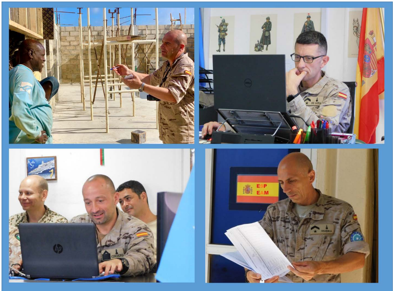
Figura 2. Cuartel General de EUTM Somalia y Equipo de Apoyo al Mando.

Para ello, EUTM mantiene sus tres pilares de acción fundamentales: el asesoramiento a la reforma del Sector de Seguridad y Defensa (SSR) a nivel del Ministerio de Defensa y del Cuartel General de las Fuerzas Armadas; la contribución al desarrollo de un sistema autónomo de formación militar, mediante el adiestramiento de unidades e instructores somalíes –más de 6 000 efectivos del ejército nacional han sido adiestrados por militares europeos– y el desarrollo de una programa de formación militar; y la mentorización del campo de instrucción de Mogadiscio, para convertirlo en un centro de excelencia de formación militar somalí.