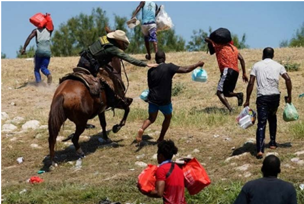
Figura 4. Agentes de la Patrulla Fronteriza de los Estados Unidos a caballo intentan evitar que los migrantes haitianos ingresen a un campamento a orillas del Río Grande cerca del Puente Internacional Acuña del Río en Del Rio, Texas, el 19 de septiembre de 2021.

Desde marzo miles de familias haitianas que buscan asilo han sido sometidas a este proceso y devueltas sumariamente a Haití.