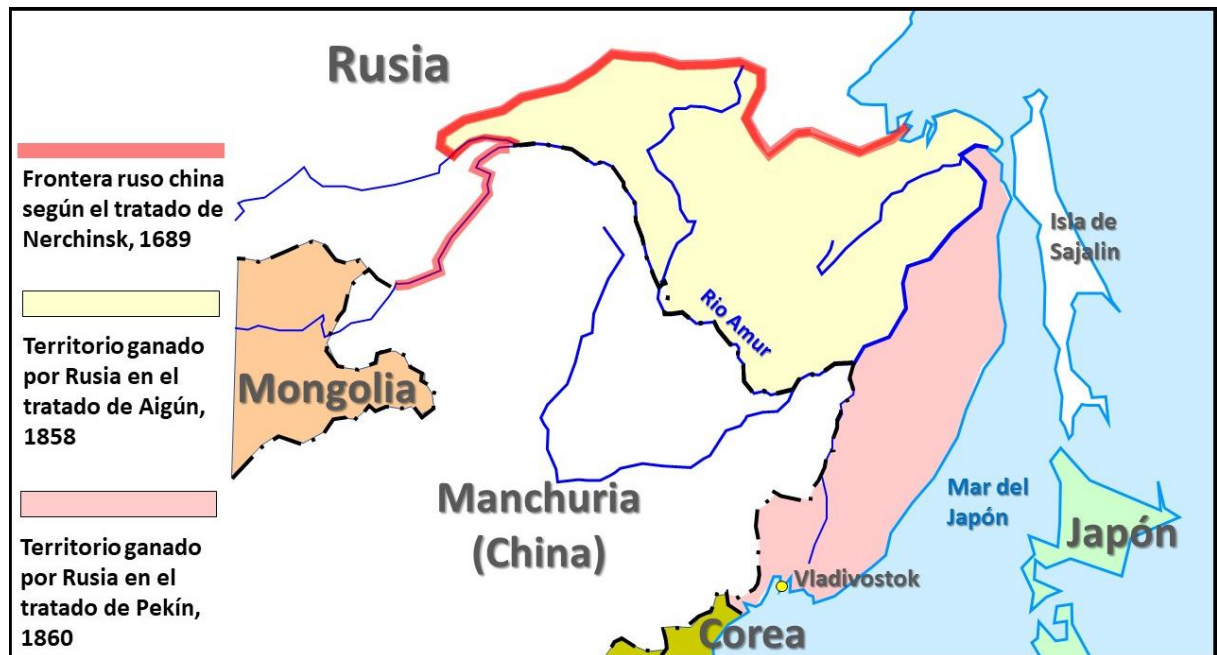
Figura 1. Territorios ganados por Rusia a costa de China en los tratados de Aigún y Pekín.

sintonía entre Mao y Stalin, la relación chino-soviética se fue deteriorando rápidamente, llegando en 1969 a un breve enfrentamiento fronterizo armado.