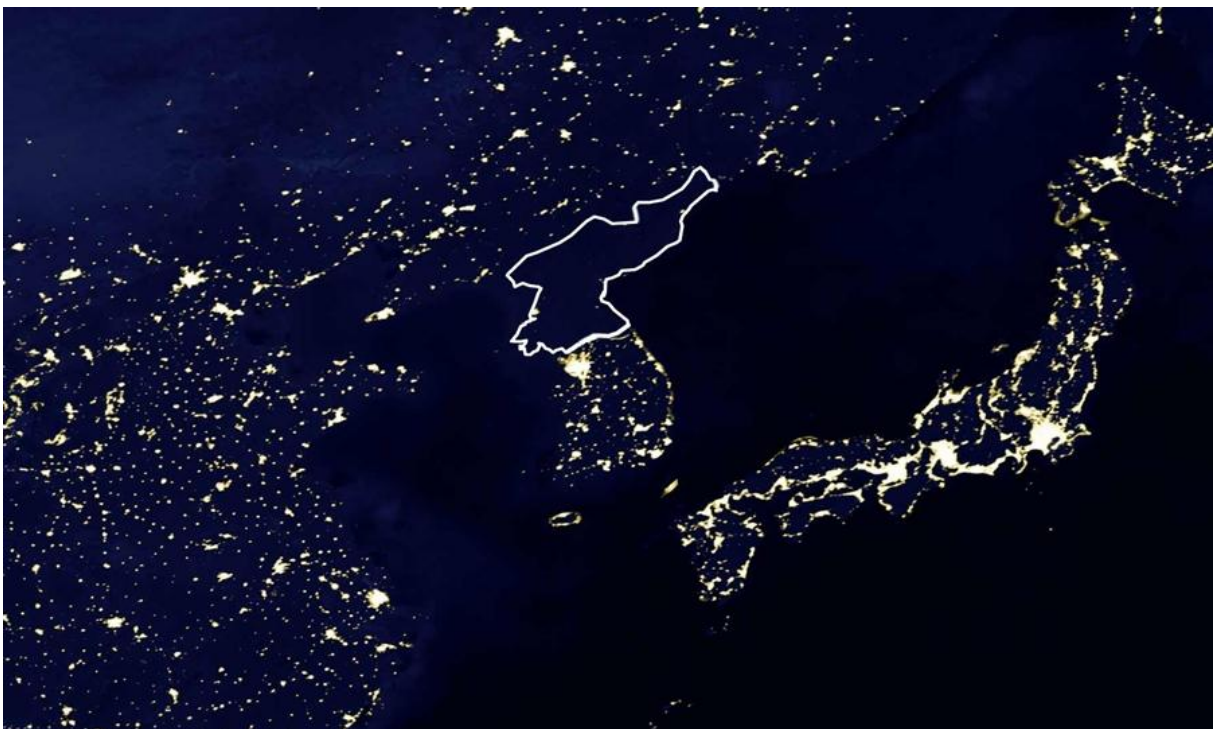
Imagen satélite nocturna de la península de Corea. Remarcados los límites de Corea del Norte

“Otra importante característica en la dinámica del conflicto se refiere a la naturaleza dinástica del régimen norcoreano. El carácter sucesorio del liderazgo del país, mientras otorga una pretendida estabilidad al régimen, genera periodos de gran tensión durante la consolidación del liderazgo y la generación del prestigio necesario para mantener la autoridad del régimen. Mientras la consolidación del Kim Il-sung se asienta durante dos periodos claves, la ocupación soviética de 1945-1948, y la guerra de corea de 1950 a 1953; la de su hijo mayor Kim Jong-Il tiene como pilar de apoyo el desarrollo del programa nuclear; quedando en suspenso el tercer relevo generacional, Kim Jong-un, con un aumento de la gravedad de los enfrentamientos convencionales 4 y, lo que parece ser, la búsqueda del reconocimiento de un estatus de potencia nuclear fuera del TNP.” 5