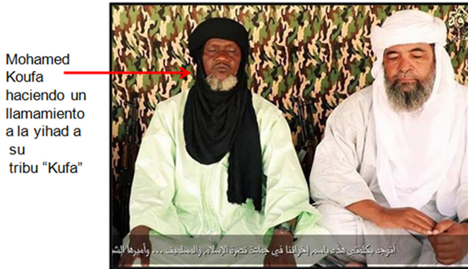
Figura 6. Vídeo de llamamientos a los fulani.

En su propaganda, JNIM utiliza de forma recurrente la condición étnica de los fulani para incitarlos a la yihad, como se puede apreciar en la proyección gráfica abajo expuesta.