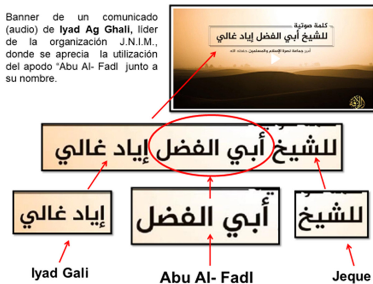
Figura 5 .Comunicado de Iyad Ag Ghali.

El material gráfico expuesto es un banner de un audio producido y difundido por la plataforma mediática oficial (Az-Zallaqa) de la organización JNIM, en la que aparece un discurso grabado del líder Ghali. En dicho banner, se puede observar claramente cómo se presenta al líder de esa organización (Ghali) con el apodo Abu Al-Fadl, acompañando su nombre original, escrito todo el conjunto en lengua árabe, relacionando así la figura del líder con la del profeta, utilizando como enlace o unión a un pariente (tío) de este último como mecanismo para reflejar y reforzar la credibilidad de la organización a la que pertenece.