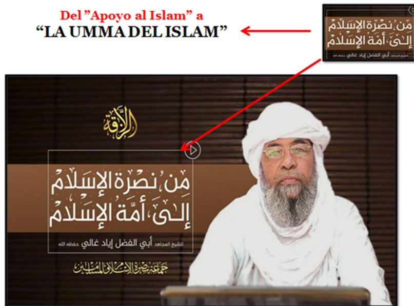
Figura 2. Mensaje emitido por la organización JNIM. Fuente. Plataforma Az-Zallaqa - Telegram.

En la figura 2, podemos observar un banner de un vídeo producido por la plataforma mediática oficial de la organización yihadista JNIM (se hablará de forma detallada de la organización más adelante). Su título es una aleya del Corán, en la cual subyace este llamamiento a la escalada, un emplazamiento que un occidental no puede entender, si bien un musulmán, independientemente de su país de procedencia, puede comprender perfectamente, ya que está estructurado teniendo en cuenta la cosmovisión islámica genérica compartida entre todos los musulmanes debido a su religión y cultura.