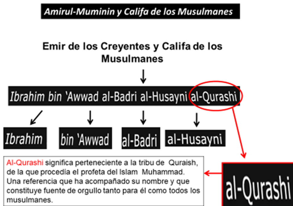
Figura 4. Árbol genealógico de Al-Bagdadi.

Con posterioridad al asentamiento del Estado Islámico en la zona de Irak y Siria, el aparato propagandístico de dicha organización insufló el nombre de su líder Al-Bagdadi mediante la creación de una cadena por medio de un árbol genealógico inventado que terminaría vinculando a dicho líder con la tribu del profeta Muhammad, en un intento de otorgarle credibilidad y, por extensión, a la organización que dirigía, como se puede apreciar en la proyección gráfica a continuación expuesta.