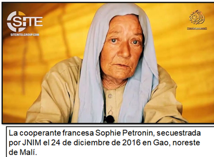
Figura 7. Comunicado dirigido a Occidente.

La organización JNIM, al igual que todas las organizaciones yihadistas, estructuró sus mensajes propagandísticos dirigidos a Occidente a base de amedrentar e infundir miedo, como se puede apreciar en la siguiente ilustración.