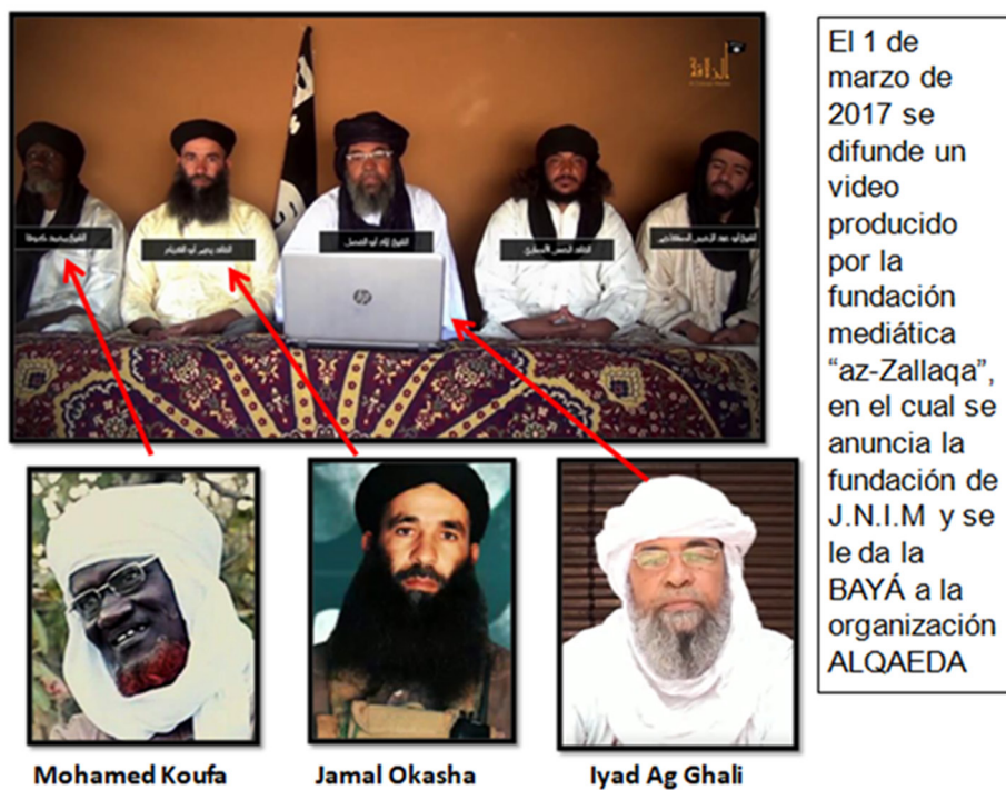
Figura 3. Comunicado conjunto.

al-Sahara) anunciando su unión bajo el nombre de Jamaat Nusrat Al-Islam Wa Al-Muslimin (JNIM) o Grupo de Apoyo para el Islam y los Musulmanes.