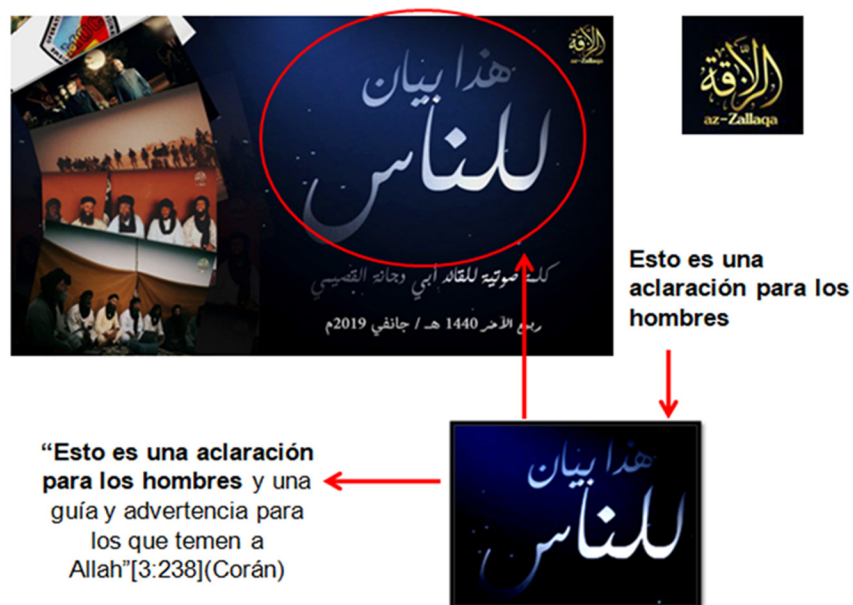
Figura 8. Ejemplo de MLI.

El material propagandístico a continuación mostrado pertenece a la organización JNIM, producido y difundido por su plataforma mediática oficial, donde podemos apreciar la utilización de las MLI como elemento de sugestión básico y fundamental. En este caso, la MLI empleada es una frase aparentemente inofensiva, vista desde la perspectiva de la cosmovisión occidental, sin trascendencia ni violencia alguna; si bien dicha expresión adquiere su verdadero poder y fortaleza cuando se aprecia desde el contexto de la cosmovisión islámica.