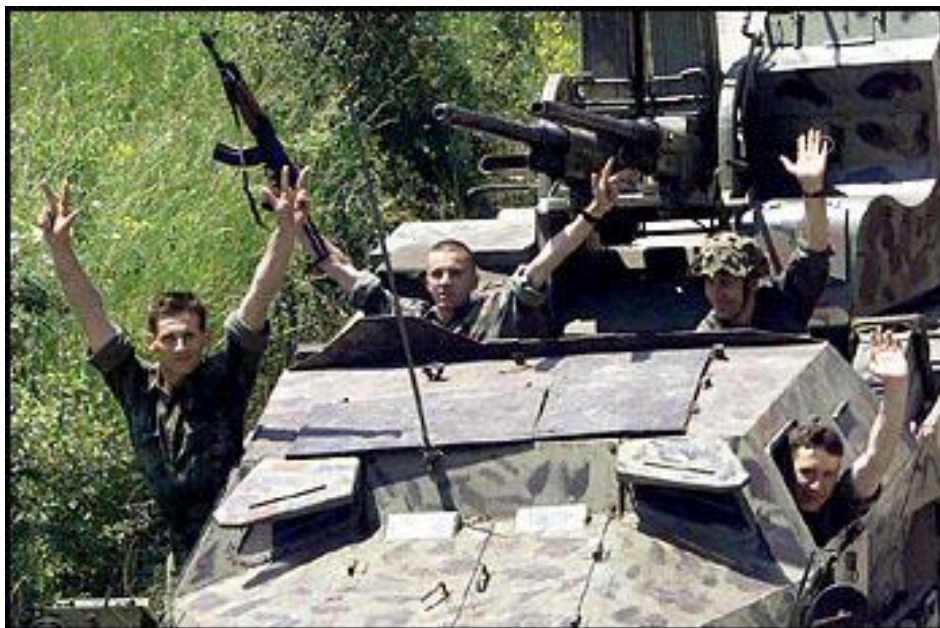
Soldados serbios en la frontera de Kosovo. Junio 99.

Tras su proclamación como Primer Ministro el 9 de enero de 2008, y haciendo caso omiso de estas recomendaciones, éste declaró unilateralmente el 17 de febrero de 2008 la independencia de la República de Kosovo 18 , con el reconocimiento inmediato de los Estados Unidos, la condena por parte de Rusia y división de la UE.