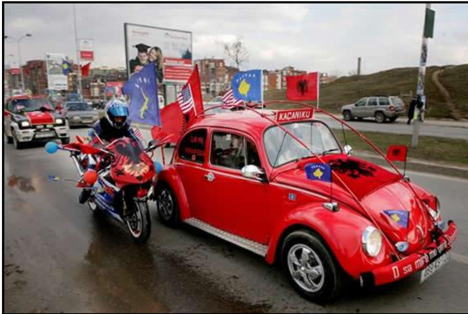
“Celebrando la independencia de Kosovo”.

derecho internacional; por ello considero que es llamativo que en esta ocasión se haga esta reseña por parte de la CIJ 23 .