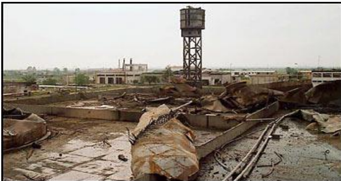
Depósito de combustible de la Compañía “Jugopetrol” tras los ataques OTAN.

Es destacable el hecho de que el ex presidente finlandés ya tenía una gran experiencia previa en estas cuestiones, puesto que jugó un papel relevante en la negociación de la independencia de Namibia con la República de Sudáfrica. El antiguo gobernante finés se mostraba partidario, ante la evidencia de las posiciones irreconciliables entre Serbia y Kosovo, de otorgar a Kosovo una “independencia” supervisada por la comunidad internacional.