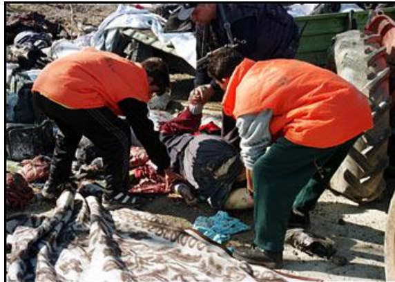
Fotografía de refugiados kosovares siendo atendidos tras ser “víctimas” ataques OTAN (Abril 99).

En el plano internacional, y teniendo en cuenta que en ocasiones la política exterior se convierte en un elemento clave en la modernización de un país, la posición serbia cambió también radicalmente 15 .