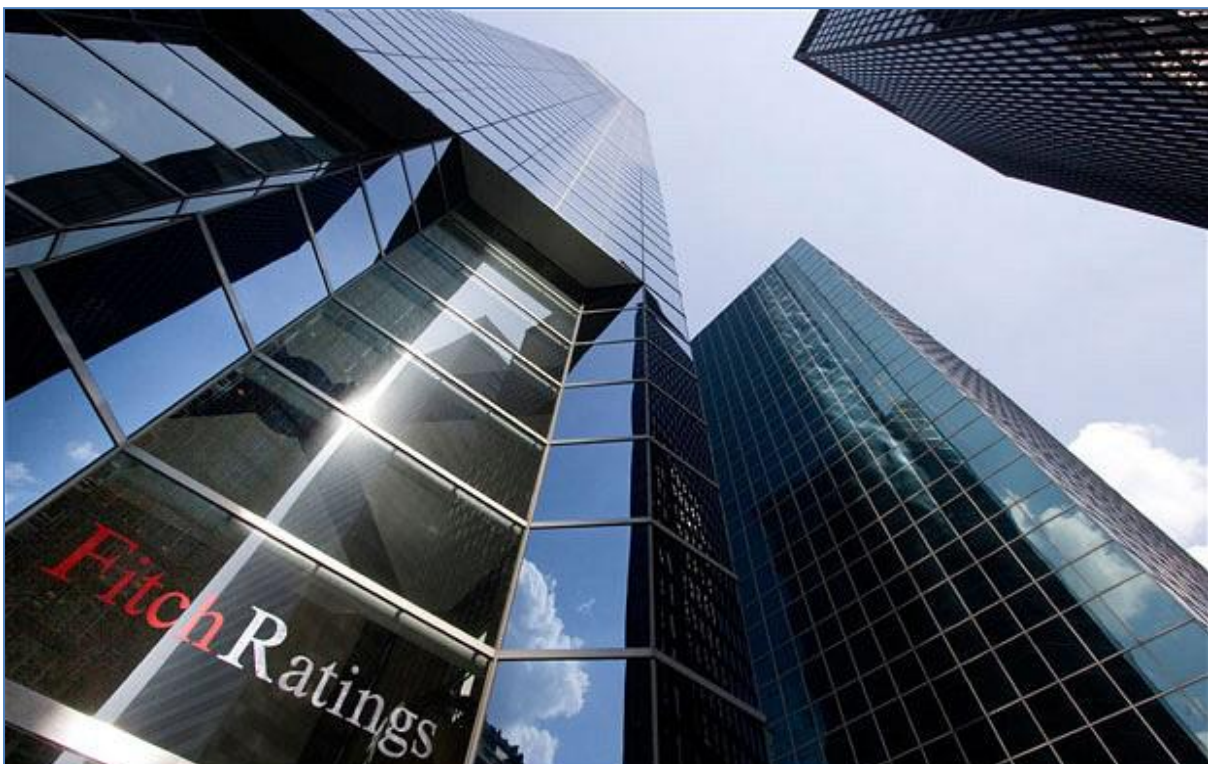
Sede de Fitch Ratings Limited en State Street Plaza de Nueva York

En concreto, la Circular 3/2008 12 plantea como requisitos que la metodología de la ECAI sea objetiva, que tenga la necesaria independencia del poder político y de presiones económicas, que esté sujeta a procedimientos de revisión continuada, que exista transparencia en cuanto a los métodos empleados para efectuar las calificaciones y por último que la agencia de rating goce de credibilidad y aceptación en el mercado, es decir, que sea una de las ECAI's de mayor implantación, lo cuál establece importantes barreras de entrada a nuevos competidores. Todo esto confiere a las agencias de rating un protagonismo casi omnipresente dentro del sistema financiero, al que deben transmitir confianza y estabilidad para que funcione de forma eficaz, tal y como refiere la Revisión Estratégica de la Defensa con el concepto de Enfoque Integral de la Seguridad 13 .