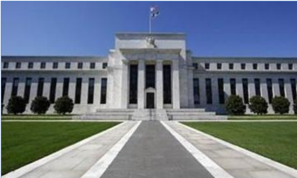
Sede central del sistema de la Reserva Federal en Constitution Avenue Northwest de Washington DC

establecidas en el territorio de la UE y registradas conforme al reglamento para que sus calificaciones puedan ser empleadas a efectos regulatorios 22 . Para su registro, que implica el pasaporte financiero comunitario 23 , será preciso presentar junto a la solicitud un informe sobre la estructura organizativa y financiera de la sociedad así como contar con consejeros de reconocida honorabilidad 24 , conocimientos y experiencia. Por otro lado, un tercio de los miembros del consejo de administración deben ser independientes y es preceptivo publicar los métodos de la ECAI , asegurándose de que la información que sustenta sus calificaciones es fiable 25 .