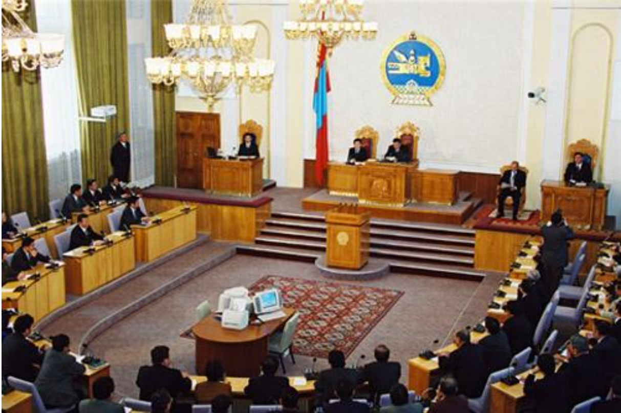
El parlamento de Mongolia en sesión.

Otro punto también muy importante ha sido ponerle límite a la inmigración, concretamente restringe el número al 0,33% de los 2,8 millones de habitantes.