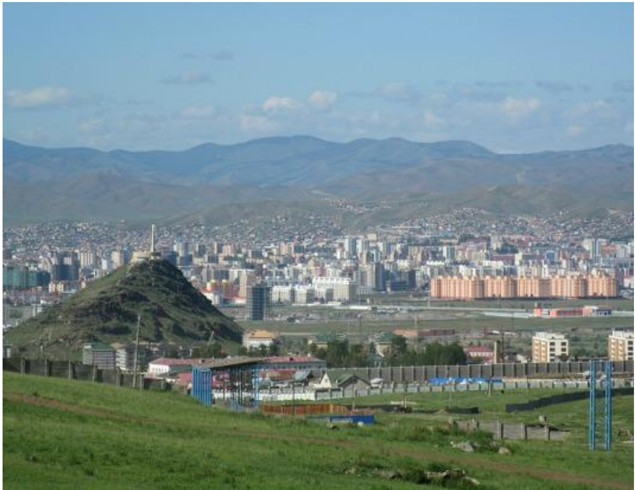
Ulan Bator, capital de Mongolia.

Actualmente en la capital, en Ulán Bator, se concentra prácticamente la tercera parte de la población, al igual que sucede en China o Rusia. Allí se pueden encontrar discotecas, caros restaurantes, tiendas de lujo y excelentes hoteles. Cercano a estos agradables locales se sitúan un elevado número de barrios donde no disponen ni de agua ni electricidad. Aunque nadie quiere reconocerlo de forma clara, muchos son los que piensan que gran parte de la responsabilidad en este proceso lo tiene el desordenado desarrollo de la minería.