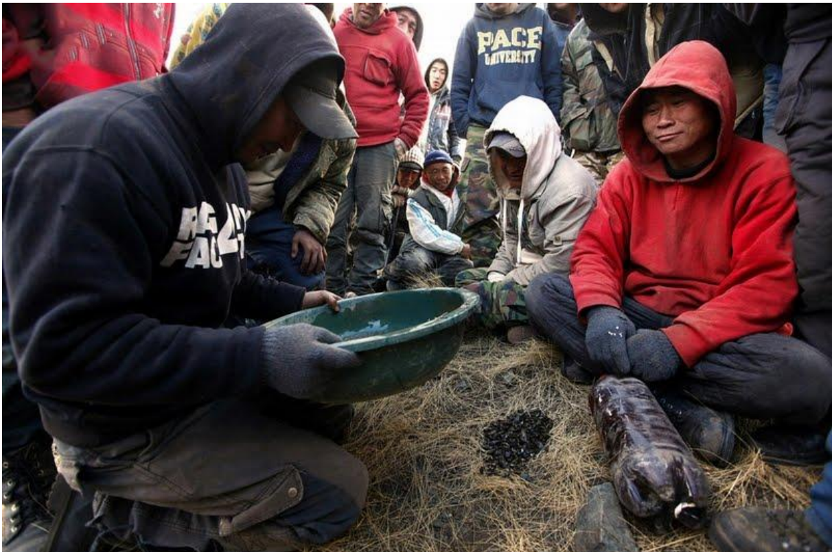
Mineros “ninjas”, trabajando por su cuenta.

Otro dato importante y explicativo se produce a mediados de los años 90 un elevado número de antiguos trabajadores de minas públicas que en ese momento estaban en paro, la mayoría muy cualificados, empezaron a trabajar por su cuenta, de forma artesanal, es decir, individualmente, en la búsqueda de oro.