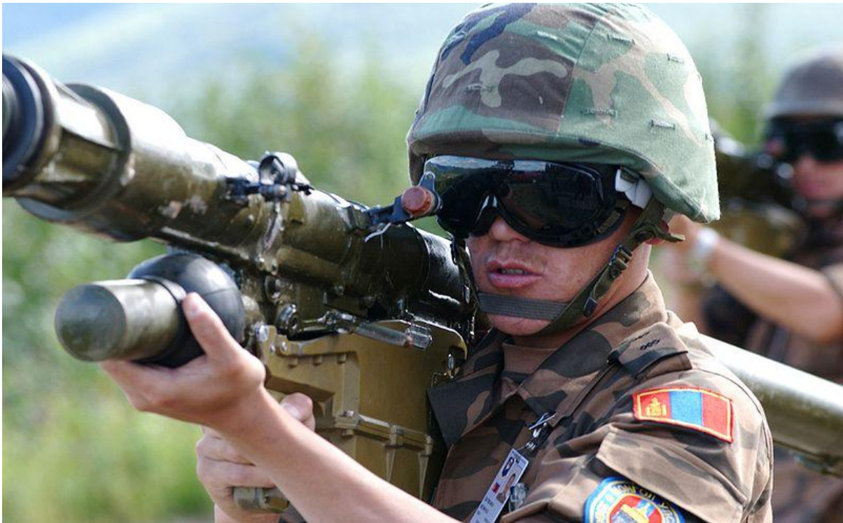
Soldado mongol en misiones internacionales.

En relación a este punto, el autor mongol Uradyn E. Bulag, en un artículo publicado en 2008 proponía rebautizar a Mongolia como <<Mina-golia>> por el enorme potencial.