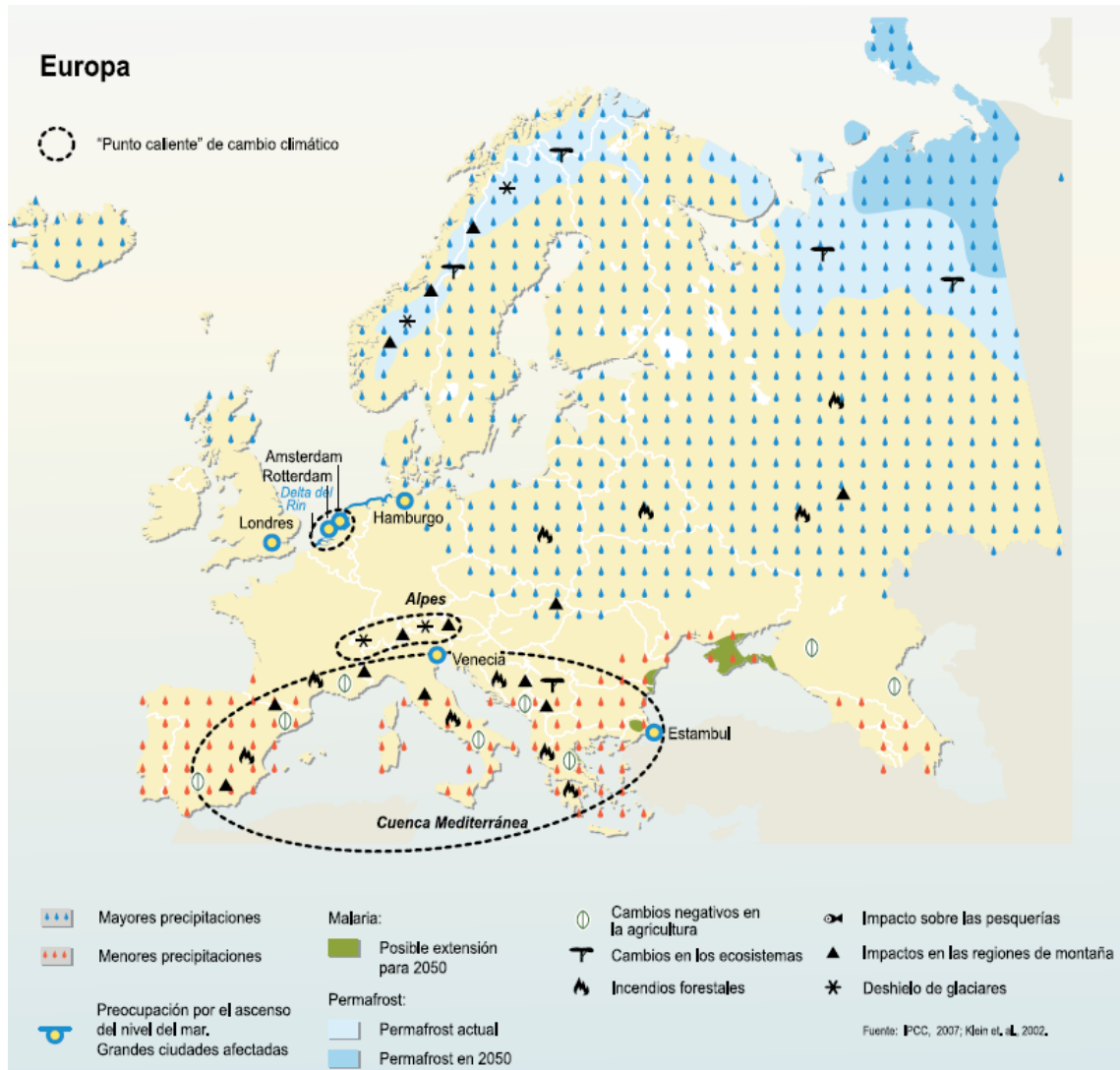
Figura 4 Principales efectos del Cambio climático sobre el continente Europeo. 10

Los principales efectos en Europa se concentrarían en los extremos meridional y septentrional por razones diferentes: