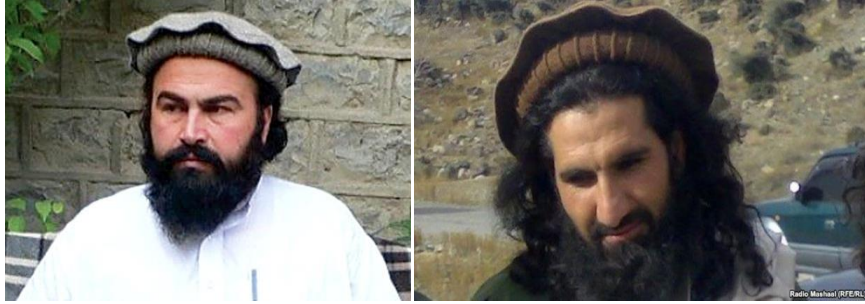
Waliur Rehman Mehsud, a la izquierda, comandante del TTP en Waziristán del Sur hasta su muerte en un ataque drone en mayo de 2013. A la derecha, su sucesor Khan Syed Sajna (Khalid Mehsud).

Con esta decisión Fazlullah podría estar tratando de afianzarse la lealtad de Khorasani, reconociéndole una posición de fuerza en las áreas tribales d la que Fazlullah carecía. En cualquier caso, Khorasani, comandante del TTP en Mohmand, tampoco contaba con una gran influencia entre los mehsud, y la decisión de Fazlullah solo vino a evidenciar su debilidad.