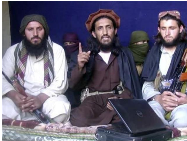
Omar Khalid Khorasani, líder del Jamaat-ul Ahrar .

Según se dice en el vídeo, unos 70 comandantes del TTP se habrían pasado a las filas de Khorasani. Se explica que la decisión de crear este nuevo grupo se basa en las disensiones en el seno del TTP, que están acabando con la organización.