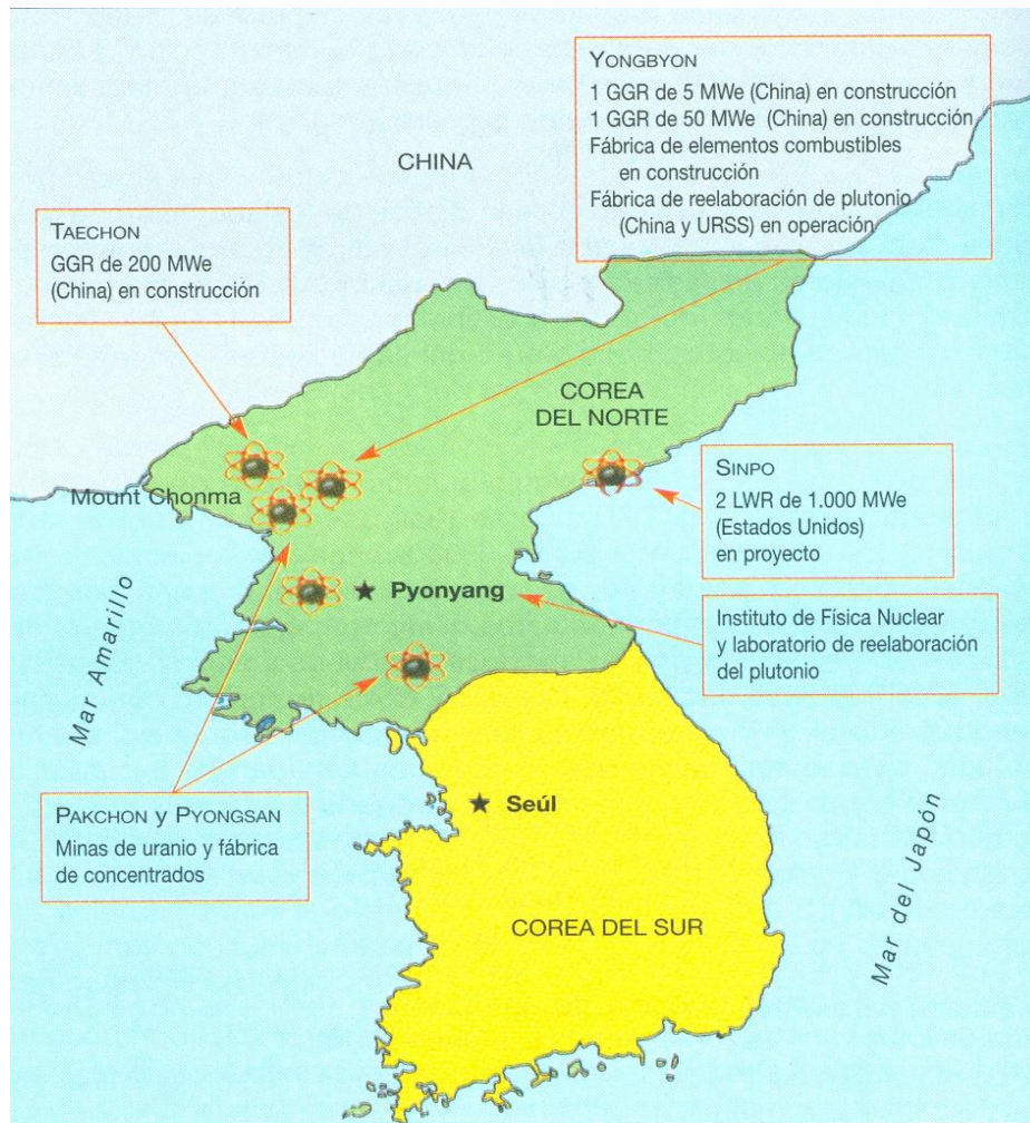
Figura 3.- Instalaciones nucleares de Corea del Norte (adaptación de diversas fuentes)

*NOTA: Las ideas contenidas en los Documentos de Opinión son de responsabilidad de sus autores, sin que reflejen, necesariamente, el pensamiento del IEEE o del Ministerio de Defensa.