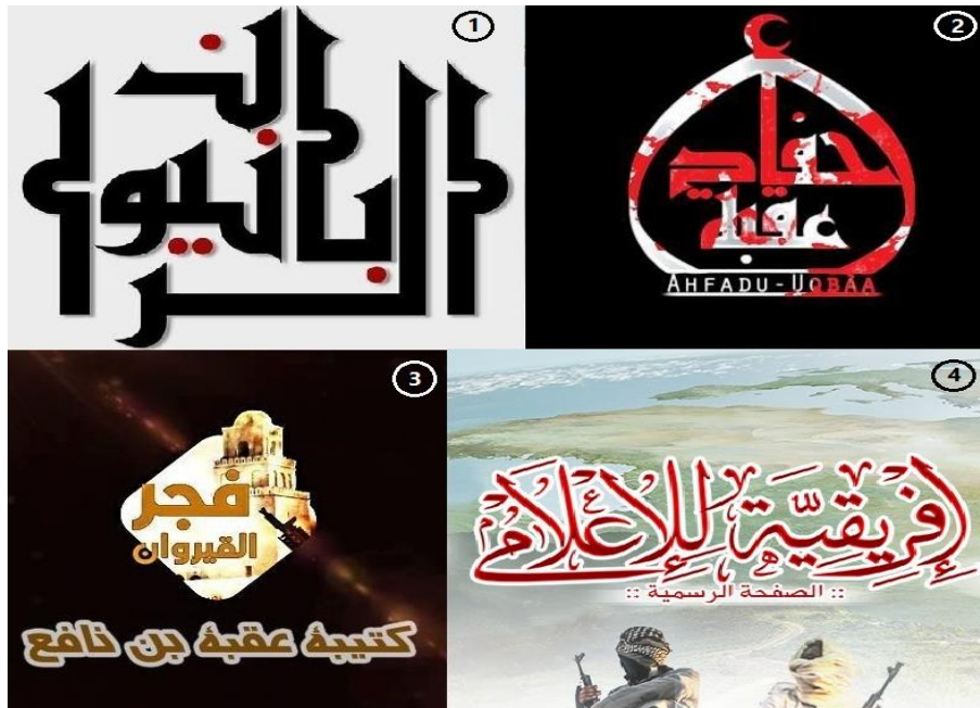
1. Al-Rabaniyoun Media -- 2. Media outlet Ahfadu Oqba Ibn Nefaa 3. Fajr al-Qairawan -- 4. Ifriqiya Media

Nefaa, si bien la descentralización ha producido curiosos resultados y cada plataforma está orientada a un público objetivo como se desglosa a continuación.