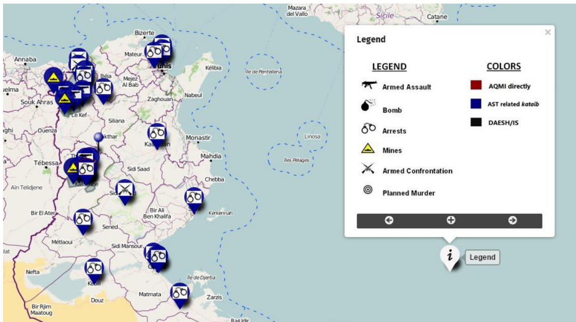
Mapa de la actividad terrorista registrada en Túnez durante 2014 (Versión interactiva disponible para su consulta en http://u.osmfr.org/m/19233/ . Créditos del Mapa: Sergio Altuna Galán)

Si 2012 se cerraba con un incremento de la violencia, 2013 cambiaría por completo el panorama de la seguridad nacional; pese a que en ningún momento quedan patentes los lazos de unión entre los actos terroristas perpetrados en Túnez y Ansar al-Sharia –ya fuesen estos perpetrados por individuos aparentemente independientes o pertenecientes a la katiba Oqba Ibn Nefaa o a la katiba Abubakkar as-Sadiq, esta última ya desarticulada 14 comienzan a ser evidentes los indicios que apuntan a una relación directa con AQMI. 15 A lo largo de 2013, la actividad terrorista aumenta exponencialmente. Ya en febrero, Abu Iyadh comienza a dejar claras sus intenciones a través de un comunicado en el que pide expresamente a los tunecinos que dejen de viajar a Siria y que permanezcan en Túnez para llevar a cabo una yihad pacífica. AQMI se haría eco de este comunicado un mes más tarde haciendo suyas las palabras de Abu Iyadh e instando a los tunecinos a quedarse para combatir el secularismo dentro de sus fronteras. Parece evidente que mantener futuros elementos útiles para poner en marcha la yihad en territorio nacional se convierte en una prioridad. Poco más tarde, ya en abril, explotan las primeras minas en Jebel Shaambi, macizo montañoso más elevado de la geografía del país y lugar en el que tiene su base de