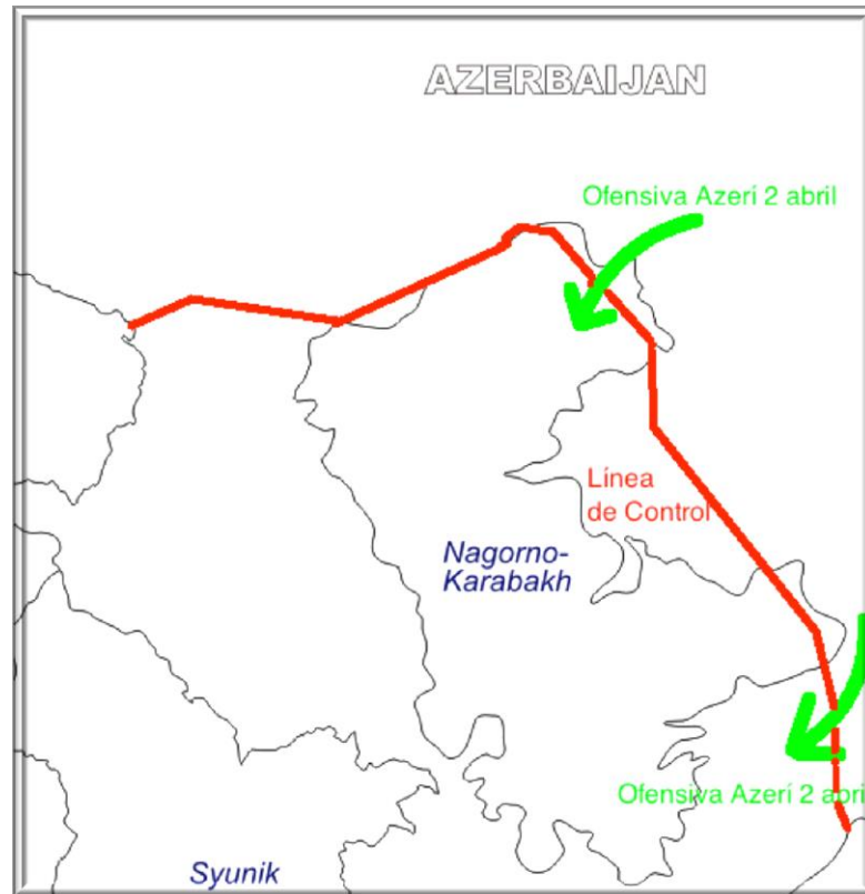
MAPA 3: Ofensiva azerí 2 de abril

las aldeas de Lalatapa 17 , Seysulan y Talysh 18 .