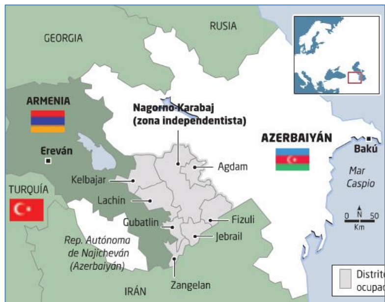
MAPA 1: Nagorno-Karabaj

El presente trabajo va a tratar de dar una visión general del conflicto, pasando por un análisis de la crisis, de sus causas y de los actores para concluir con una pequeña visión de futuro sobre el conflicto.