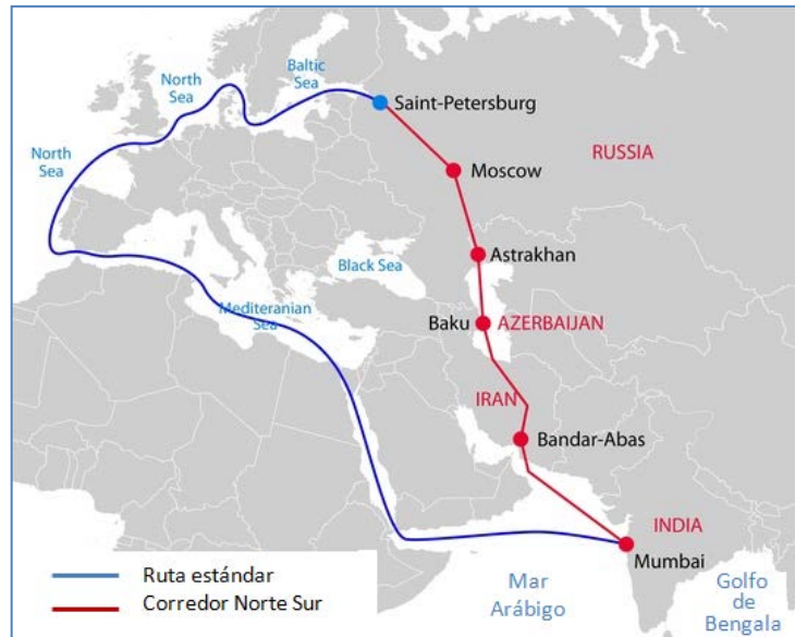
Figura 3. El Acuerdo de Ashgabat desarrolla la ruta multimodal desde la India al mar del Norte

Pero este acuerdo establecido entre China y Pakistán para aprovisionarse de petróleo desde Irán, debemos contemplarlo desde una perspectiva regional. Los intereses de los Estados de Asia central, la Federación Rusa e India están mejor defendidos a través del Acuerdo de Ashjabat 28 , en el que no está China. Además, para Rusia, el gasoducto Irán-China es un proyecto que va en contra de sus intereses regionales. Se trata de un acuerdo de transporte multimodal de mercancías entre Asia central y el golfo Pérsico. Este último acuerdo ha sido firmado por Kazajstán, Uzbekistán, Turkmenistán, Irán, Omán, Pakistán e India y pretende desarrollar una ruta multimodal alternativa a la habitual. Del mismo modo que China ha desarrollado su estrategia OBOR a través de Asia central, India ha hecho lo propio. El Acuerdo de Ashjabat facilita el acceso al mar de los Estados de Asia central a través del enorme muelle que es India. Pero también existen otras salidas hacia el sur desde Asia central como, por ejemplo, el paso de Kiber o el puerto de Gwadar, entre otros. El paso de Kiber comunica Afganistán con Pakistán, conectando la ciudad de Landi Kotal con el valle de Peshawar, pero no se trata de una zona estable. Del mismo modo los puertos de Chabahar y Bandar Abbas en Irán también son alternativas para buscar la salida desde Asia central.