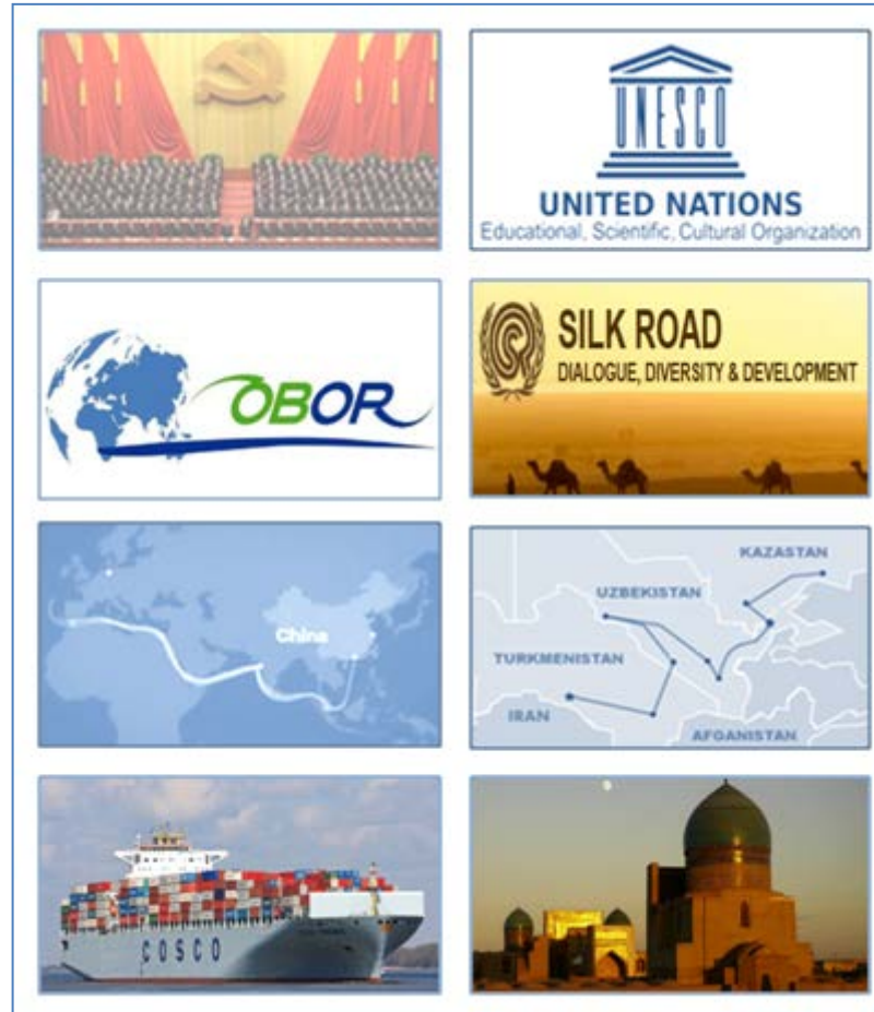
Figura 1. One Belt, One Road (OBOR) de China (izda.) y la Ruta de la Seda de la Organización Mundial del Turismo (dcha.)

La Nueva Ruta de la Seda (NRS), la Ruta de la Seda del siglo XXI, la Belt and Road Initiative (BRI), o One Belt, One Road (OBOR), son términos que se usan indistintamente para referirse a una única realidad: el interés de China por desarrollar sus propias infraestructuras logísticas en todo el mundo para, de esta manera, asegurar su comercio global, así como el aprovisionamiento de materias primas y energía. Como hemos visto, China se unió al proyecto de la UNESCO en 2011 y en marzo de 2012 participó en la reunión en Taskent con la OMT y las cinco repúblicas centroasiáticas. Ese mismo año, en el mes de noviembre, Xi Jinping fue nombrado secretario del Partido Comunista Chino y el 14 de marzo de 2013 presidente de la República. Tan solo seis meses después, Jinping en la Universidad Nazarbayev de Kazajstán, el 7 de septiembre de 2013, pronunciaba un discurso en el que llamaba a unir esfuerzos para construir conjuntamente una «Franja Económica de la Ruta de la Seda». Refiriéndose a la construcción de infraestructuras de transporte de mercancías y de energía a través de Asia central hasta China. En octubre durante otro discurso, esta vez ante el Parlamento de Indonesia, Xi