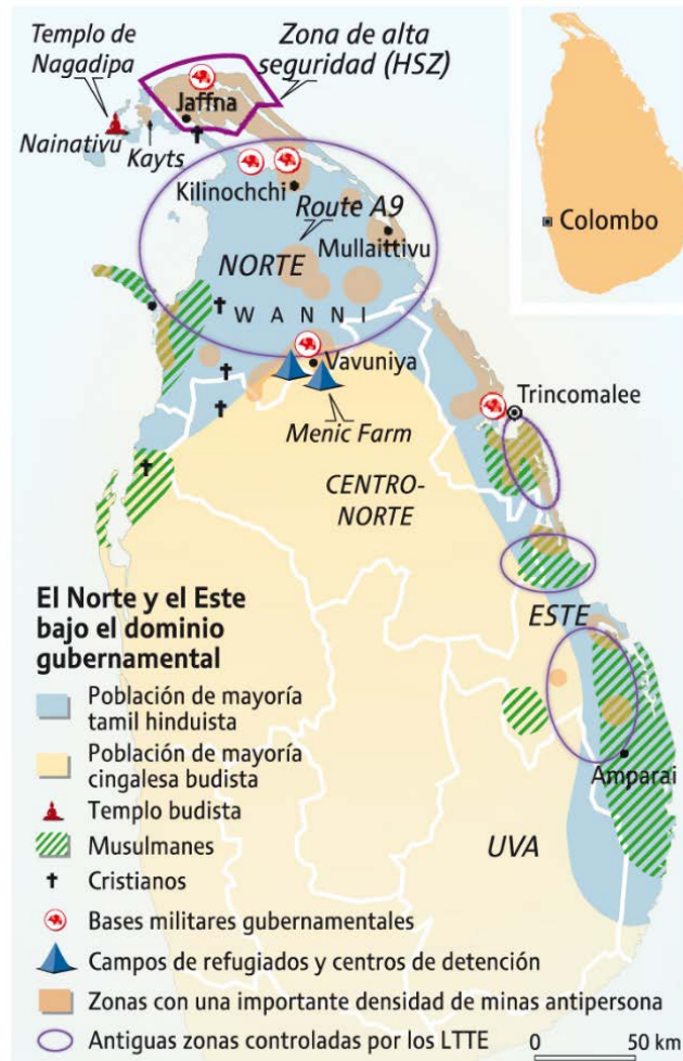
Figura 4: distribución de las zonas de mayoría tamil.