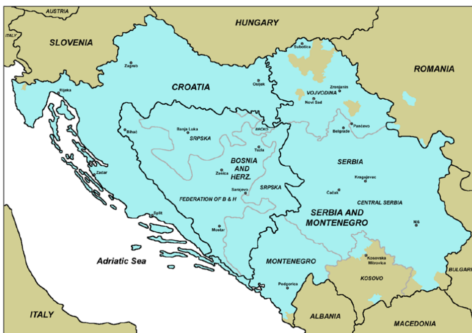
Figura 1: Áreas en las que el idioma mayoritario es una variación de la lengua serbocroata.

idioma. En el caso de la lengua croata, a la que se ha aplicado un proceso de diferenciación más intenso, se han introducido arcaísmos y neologismos, y ha surgido una intensa tendencia purista de lenguaje. En Serbia, donde los procesos de diferenciación fueron menores, la nueva Constitución de 2006 estableció como oficial el alfabeto cirílico, mientras que hasta entonces se había empleado el alfabeto latino en el ámbito oficial. Los hablantes del bosnio, por último, han logrado diferenciarse del serbio y el croata mediante la introducción de términos procedentes del turco y del árabe 21 .