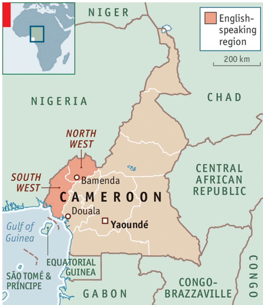
Figura 2: regiones angloparlantes de Camerún.

Fuente: Institut Canadien des Affaires Mondiales (2018).