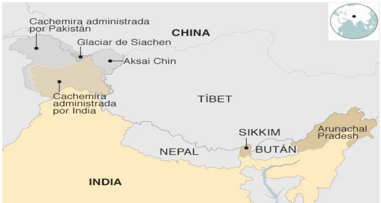
Figura 4. Territorios reclamados a India por sus vecinos (en marrón) y división de Cachemira entre China, India y Pakistán.

Ante la imposibilidad de vencer Pakistán a India en un conflicto armado 51 , decidió apoyar, casi indisimuladamente, a las células terroristas nacidas en Cachemira. Primero fue a nacionalistas cachemires, pero su tendencia separatista les disgustó y entonces a partir de 1989-1991 el Servicio de Inteligencia Pakistání financió y apoyó a grupos integristas musulmanes, muchos de ellos veteranos de Afganistán que ya no solo operaban en la Cachemira india, sino también en el resto del espacio de la Unión, teniendo como principal atentado el cometido en el año 2008 en Bombay 52 . Pakistán, animada en un principio por EE. UU., se convirtió en el paladín de los talibanes en Afganistán y, por ende, de Al Qaeda y utilizó a este monstruo para sus intereses frente a la India 53 . Ello ha dado lugar una mayor complejidad al planteamiento de la RPCh de sus relaciones internacionales; posiblemente ello ha permitido el puntual entendimiento entre China e India a finales de los ochenta.