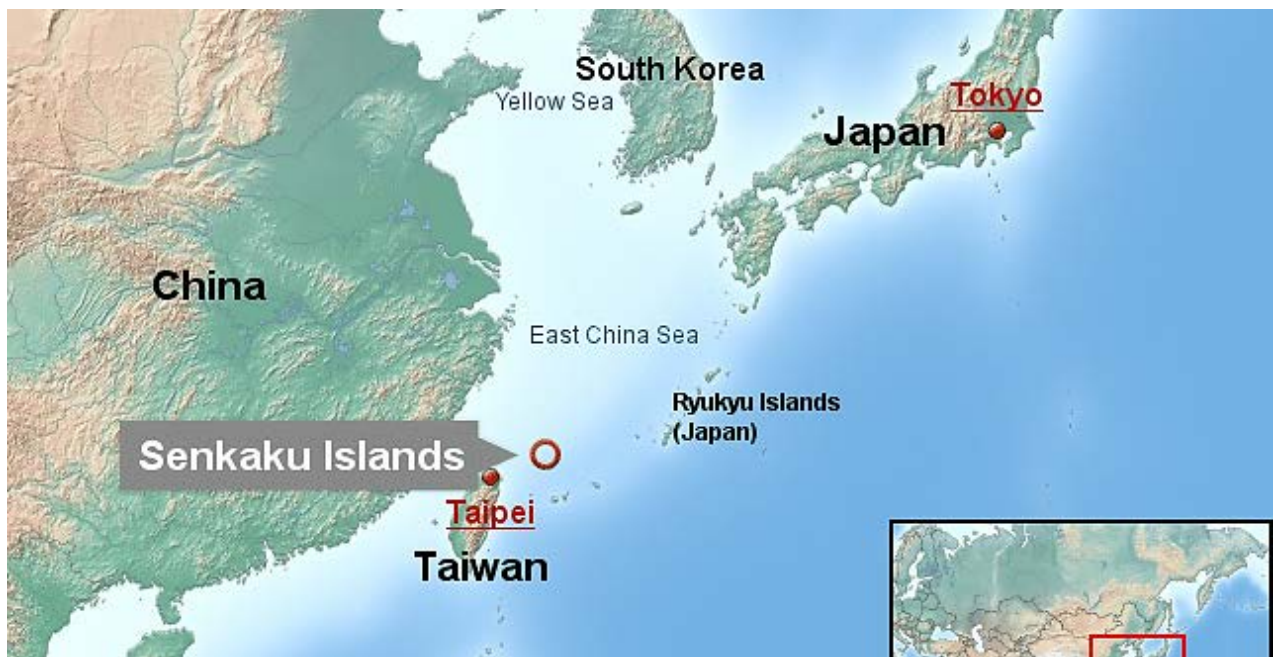
Figura 1. Ubicación de las Islas Senkaku, mar del Este de China.

con la costa china, al sur por Taiwán, al norte por el mar Amarillo y al este con las islas japonesas Kyushu y Ryukyu. Las islas reclamadas por China en el mar Oriental de China son las Senkaku, un archipiélago formado por ocho islotes deshabitados que en total no suponen ni 5 km 2 , un pequeño grupo de islas entre Taiwán y Japón, a 170 km de Taiwán y del archipiélago de Ryukyu y de 330 km de China continental 3 . Al sur, entre otras, China reclama su soberanía sobre las Paracelso y las Spratly en contraposición de otras potencias ribereñas del sudeste asiático (Vietnam, Malasia, Filipinas y Brunei), además de Taiwán que presenta las mismas pretensiones que la RPCh. Las Paracelso son un grupo de pequeñas islas (en torno a 30) ubicadas frente al golfo de Tonkín, más o menos a 200 millas náuticas de la isla china de Hainan y de la costa vietnamita. Las Spratly son un grupo extenso de islotes (un total de más de 100), que ocupan un amplio espacio en el mar encontrándose al oeste de Filipinas y al noroeste de Borneo, pero cuya superficie es mínima (no más de 4 km 2 ) y están despobladas 4 .