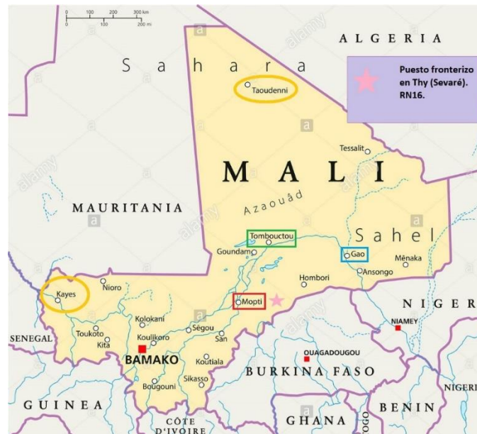
Carte 2. Principales villes sur les routes migratoires vers l'Europe au Mali Élaboration propre.

De même, les migrants qui traversent le Mali pour se rendre au Maghreb sont exposés au risque d'être kidnappés et devenir ainsi victimes du trafic humain 13 . Le travail forcé dans les mines de sel de Taoudenni dans le nord du pays est remarquable. Des femmes et des jeunes filles sont transportées, pour trafic sexuel, vers le Gabon, la Libye, le Liban et la Tunisie 14 .