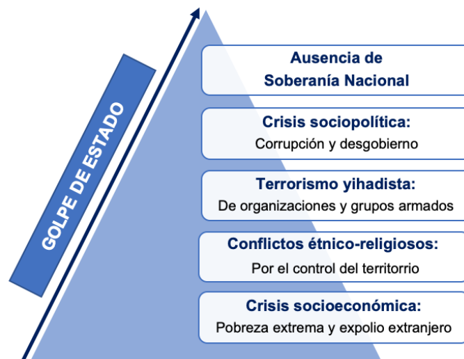
Figura 2. Cúmulo social y político en Mali.

Claramente, Mali y el resto de los Estados del Sahel conforman una región subdesarrollada con serios problemas estructurales de índole social, económica y política. En primer lugar, la corrupción habitual de Gobiernos e instituciones y los continuos enfrentamientos étnicoreligiosos son el caldo de cultivo para la insurgencia y el estallido de conflictos violentos. A su vez, el Gobierno suele favorecer a un sector étnico del país —en función de sus propios intereses—, motivando revueltas internas en el resto de la población al sentirse excluidos del sistema o no tomar parte de los beneficios que se generen. A consecuencia de esta situación, los esfuerzos estatales se concentran continuamente en «intentar» garantizar la seguridad y la estabilidad nacional sin poder hacer frente de manera contundente al desarrollo económico de la sociedad.