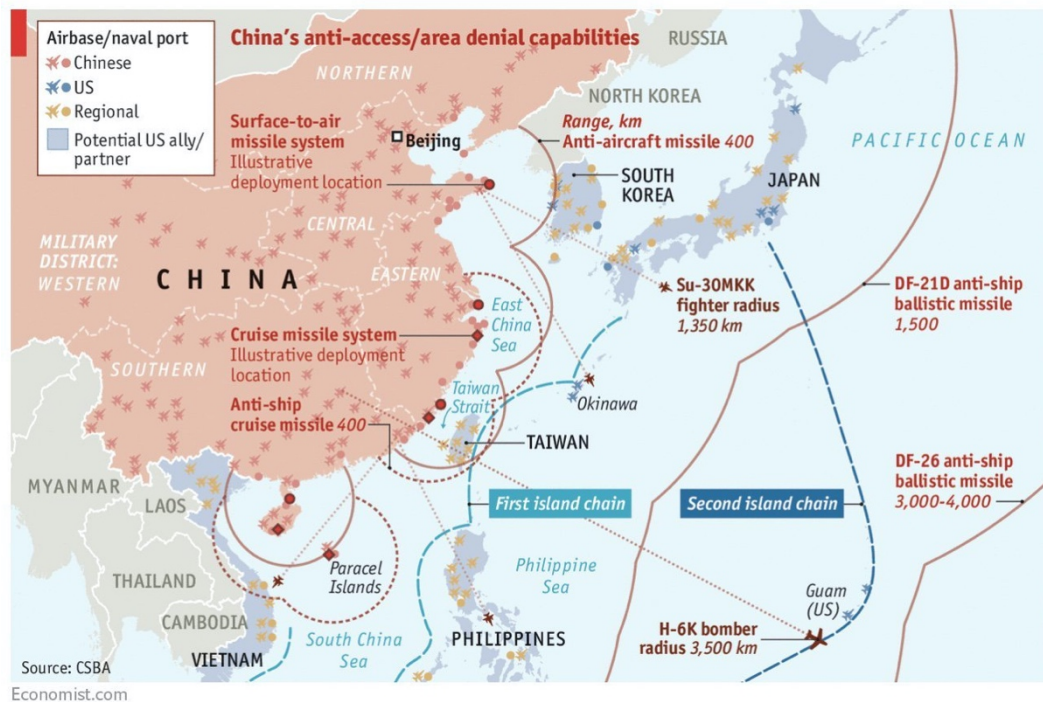
Figura 4. Muestra las bases navales y del aire de Estados Unidos y China y el alcance de su ataque como defensa.

Las actuaciones conjuntas con los miembros del QUAD incrementan y a medida que pasa el tiempo se va conformando una estrategia con el objetivo de frenar las aspiraciones chinas. En 2020, Australia y Japón firman un pacto de defensa, el cual permitirá a las fuerzas de ambos países entrenar en el territorio del otro, el acuerdo marcará la primera vez en 60 años que el país nipón aprueba un acuerdo que permite a tropas extranjeras operar en su territorio. En 2021, Australia se desligó de la iniciativa de The Belt and Road Initiative (BRI) . Japón, durante la pandemia de la COVID-19, ha proporcionado ayuda a la India de un valor de 9,3 millones dólares. La India en 2021 ha incrementado su fuerza marítima y en el último mes de agosto ha intensificado sus ejercicios navales en el mar Meridional de la China, siendo en este verano el miembro del QUAD con una mayor actividad militar en la zona.