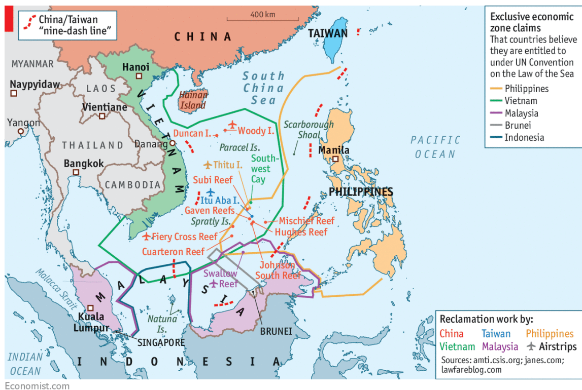
Figura 1. Muestra las reclamaciones territoriales en el mar de la China Meridional de todos los Estados en conflicto.

De los siete países a los que el mar de la China Meridional baña sus costas, seis están en disputa por él y su EEZ. Taiwán, Malasia, Vietnam, Brunéi, Indonesia y Filipinas se enfrentan al deseo de crecimiento territorial chino, que en estos momentos ve una oportunidad de expandirse a través de Taiwán y las islas Paracel y Spratly, como todas aquellas islas de creación artificial china que tienen como objetivo ampliar su Zona Económica Exclusiva.