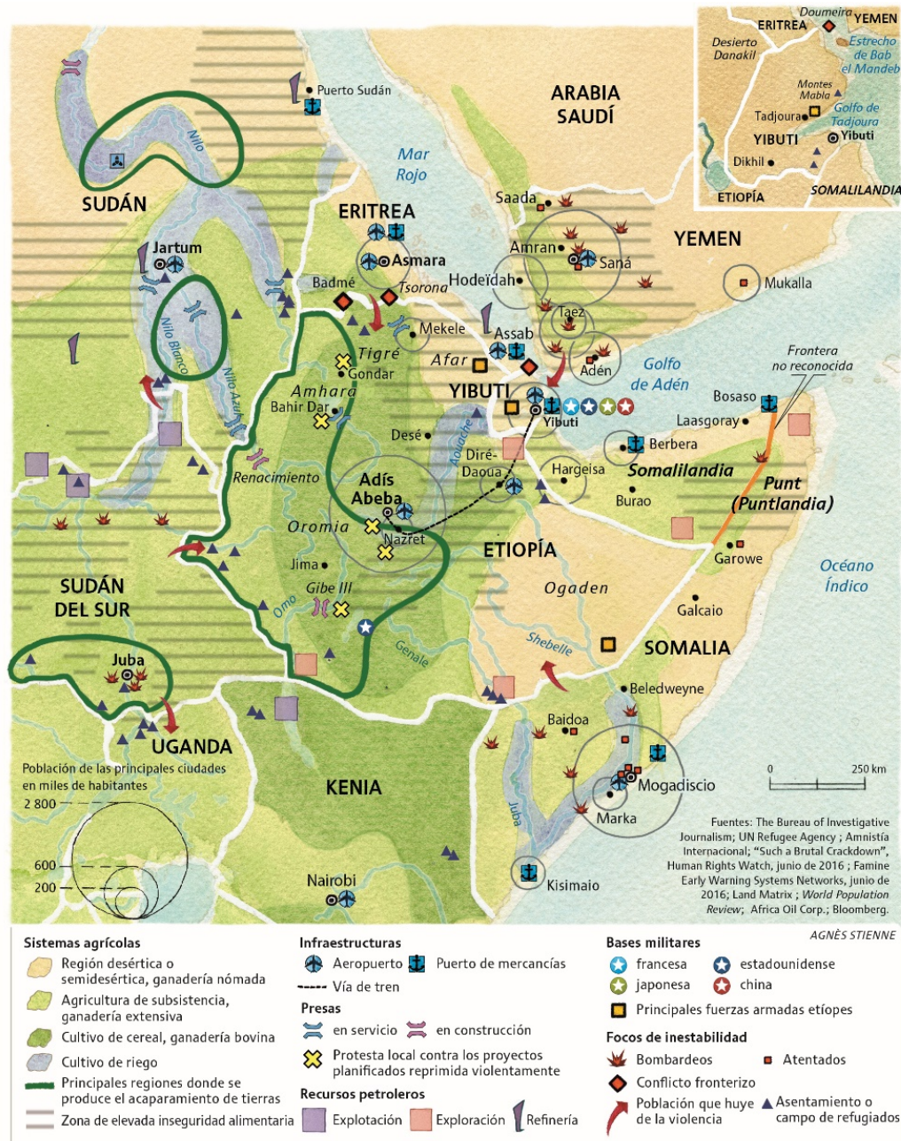
Figura 1. Principales infraestructuras del Cuerno de África. Fuente. Le Monde Diplomatique . Disponible en:

se está convirtiendo en un símbolo de orgullo nacional etíope, una especie de elemento de participación con el que construir una Etiopía más cohesionada y unida 11 .