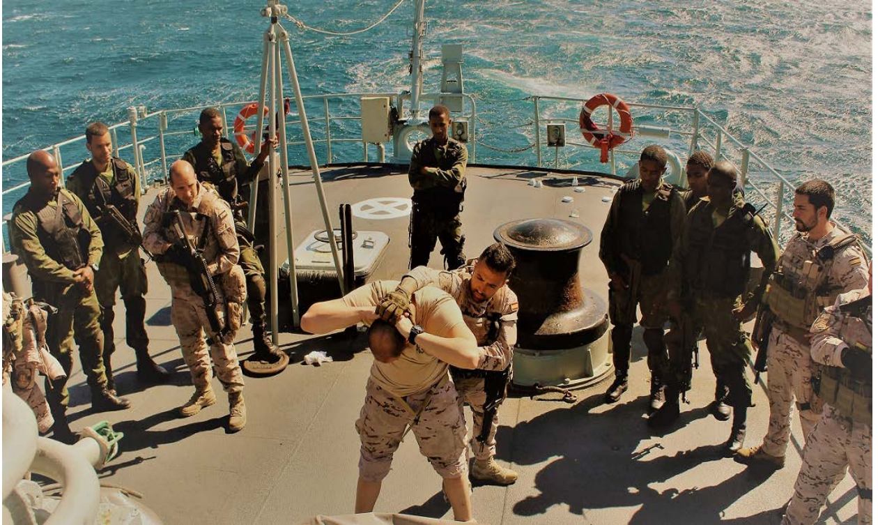
Figura 3. Actividades de formación en técnicas de abordaje y seguridad.

El despliegue africano aporta presencia permanente en esta zona de vital interés para la seguridad española, tal y como señala la Estrategia de Seguridad Nacional en referencia al golfo de Guinea. Las actividades que llevan a cabo las unidades desplegadas se centran en la Seguridad marítima y cooperativa mediante labores de asesoramiento, instrucción y adiestramiento. El fortalecimiento de capacidades militares (vigilancia marítima, seguridad física, interdicción marítima, buceo, evacuación de bajas, etc.) redunda en la protección de los intereses nacionales: suministro energético, pesca y líneas de tráfico marítimo con España.