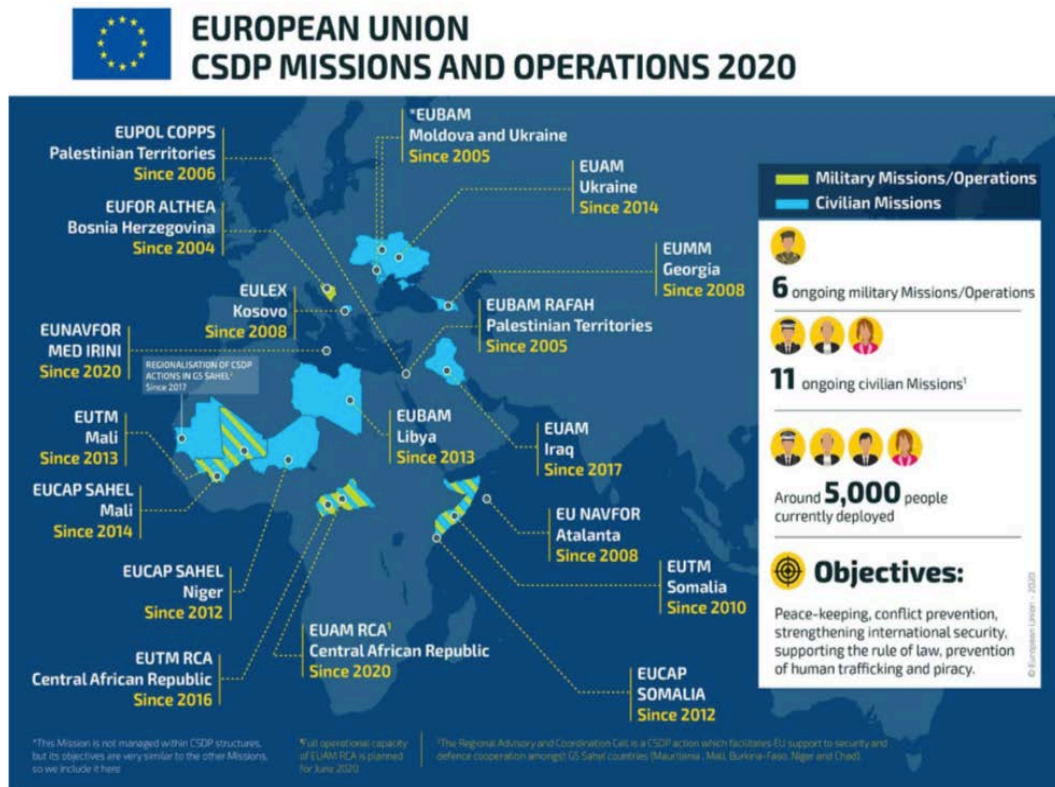
Figura 4. Misiones y operaciones PSCD 2020.

Otro de los aspectos que ofrece dudas es la forma en que el Consejo de la UE dará la orientación estratégica a la CMP y cómo esta se traducirá en directrices operacionales sin la existencia de un Cuartel General operacional. Cuesta entender por qué no se aplican en esta región las medidas que, con tanto acierto, se aplicaron en Somalia.