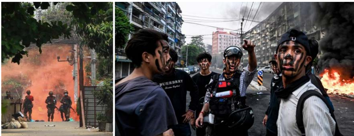
Figura 6. Imágenes de los disturbios en Yangón el pasado 30 de marzo.

A lo largo de la madrugada del 1 de febrero, 84 altos cargos de la LND fueron detenidos 25 , incluyendo además de a los tres líderes del ejecutivo, al secretario general del partido, Nyan Win, y a su portavoz, Aung Shin, ambos condenados a arresto domiciliario indefinido. Entre los cargos presentados por las autoridades destacan los de fraude electoral 26 , importación ilegal de sistemas de comunicación 27 , apropiación indebida,