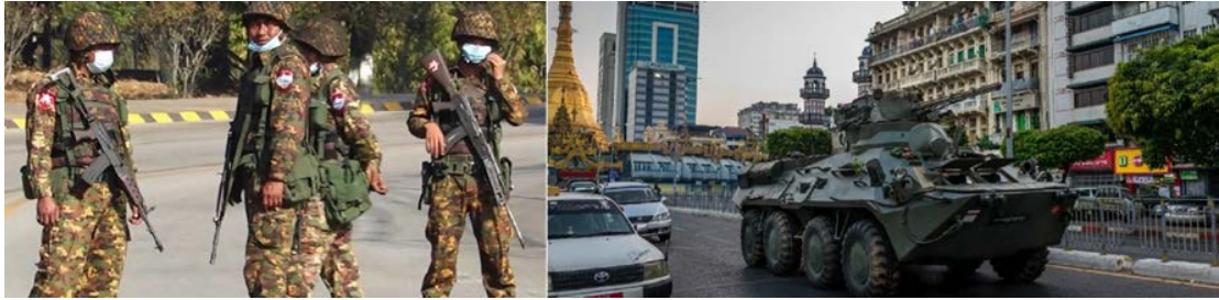
Figura 1. Tropas en las calles de Naypidaw (izda.) y blindado BTR-3 frente a la pagoda de Sule, en el centro de Yangón (dcha.).

La mañana del 1 de febrero varios convoyes de carros blindados irrumpían en Naypidaw, tomando el control de los edificios gubernamentales de la capital birmana. La escena se repetía en la mayoría de las ciudades de importancia, desde Dawei a Monywa, pasando por Yangón, donde las tropas ocupaban de manera gradual los edificios administrativos y establecían controles de tráfico. Horas antes la mayoría de canales de televisión y radio habían dejado de funcionar alegando «dificultades técnicas», al tiempo que en un nutrido número de regiones el servicio de Internet se desplomaba. A las 11:00 am hora local, el comandante en jefe de las fuerzas armadas 1 , el general Min Aung Hlaing 2 , declaraba a través de la televisión nacional el derrocamiento del gobierno, decretando la ley marcial por espacio de un año. En su comparecencia aprovechó también para anunciar el arresto de la mayoría de altos cargos de la Liga Nacional para la Democracia (LND) 3 en una serie de redadas llevadas a cabo la madrugada anterior, y que incluían entre otros al hasta entonces presidente, Win Myint, y a la consejera de estado 4 , Aung San Suu Kyi, histórica activista por la democracia y rostro visible del gobierno.