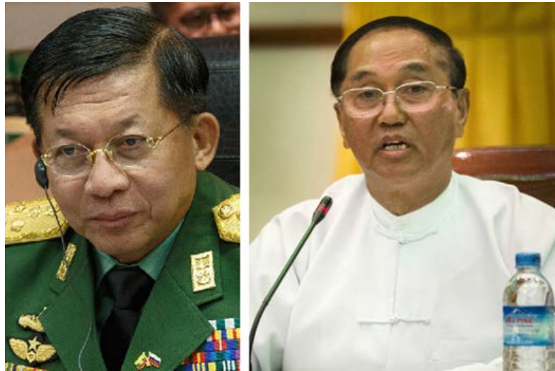
Figura 2. El general Min Aung Hlaing (izda) y el nuevo presidente, Myint Swe (dcha).

Pese a que la cúpula militar ha entregado la presidencia al hasta entonces vicepresidente, Myint Swe 5 , el control real del estado queda en manos de quién es el jefe del Estado Mayor desde 2011. Nacido en la ciudad costera de Tavoy 6 (sur), el 3 de julio de 1956, Min Aung Hlaing procede de una familia de funcionarios públicos. Conocido por su carácter observador y taciturno, creció en Rangún al obtener su padre un puesto en el Ministerio de Obras Públicas. Miembro de las fuerzas armadas desde 1974, consiguió superar las pruebas de acceso a la academia de oficiales en su tercer intento.