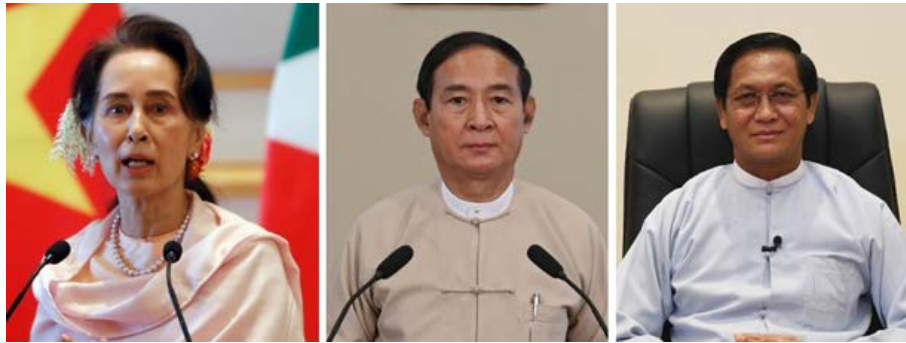
Figura 3. De izquierda a derecha: la hasta ahora consejera de estado, Aung San Suu Kyi; el expresidente Win Myint, y el ex-vicepresidente adjunto, Henry Van Thio, fueron todos arrestados el 1 de febrero.