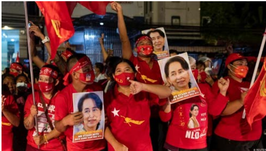
Figura 4. Partidarios de la LND celebrando los resultados de los comicios del 8 de noviembre de 2020.

Las esperanzas de los líderes democráticos quedaban, por tanto, depositadas en que la consecución de victorias masivas en las urnas y la apertura al exterior favorecieran una flexibilización progresiva de la postura de los militares, desembocando en una serie de enmiendas a la carta magna que permitieran garantizar una democratización plena. Sin embargo, este último movimiento se antojaba altamente complicado de conseguir pues, para acometer tales reformas, es necesario contar con un mínimo del 75 % de los votos en la Cámara de Representantes. Para ello sería necesario aunar el respaldo de todos los votos procedentes de los partidos democráticos, una empresa poco menos que imposible 15 .