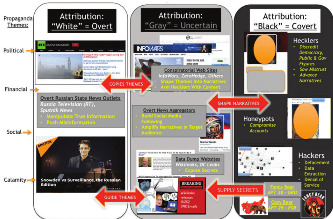
Figura 2. Medidas activas rusas en redes sociales.

comunicación tradicionales. Esta amplificación de la difusión no tiene precedentes en la historia de las medidas activas.