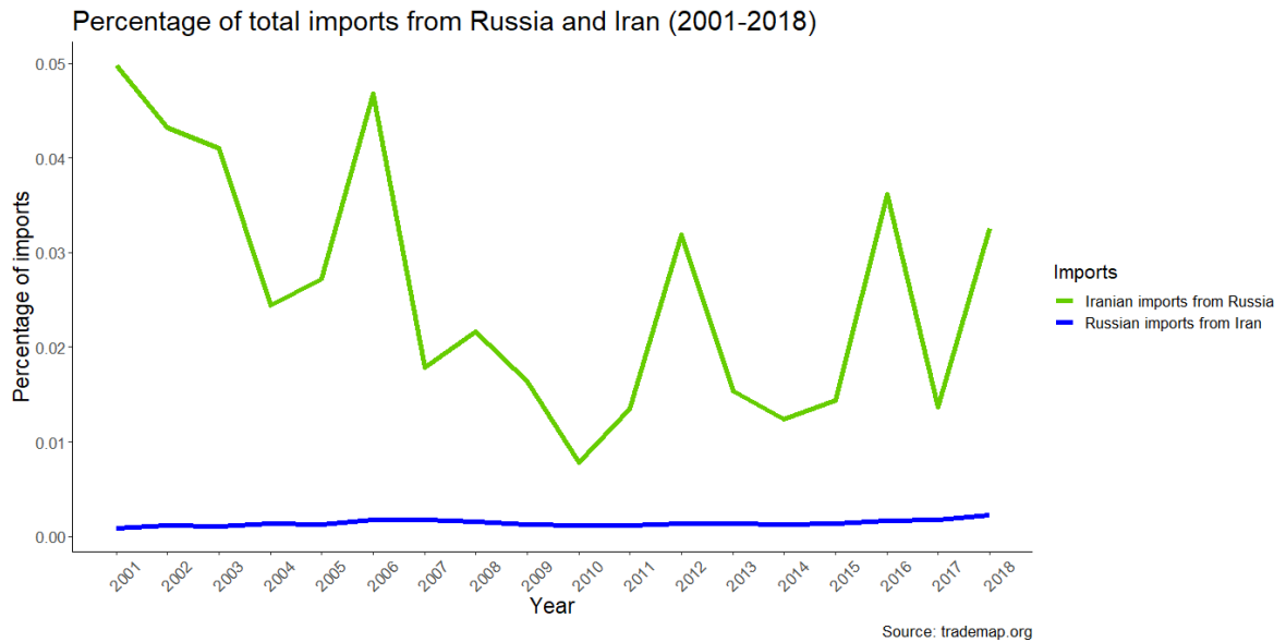
Gráfico 2: Importaciones totales de Rusia e Irán (2001-2018). Elaboración propia

Con respecto al motivo de sus inestables relaciones económicas, parece ser una consecuencia de las sanciones impuestas por la comunidad internacional contra el programa nuclear de Irán. En particular, en 2010, la ONU ejecutó un embargo sobre la exportación de la mayoría de las principales armas convencionales a Irán. Como las exportaciones de Rusia a este país están compuestas principalmente por artículos militares, es razonable que estas exportaciones hayan disminuido desde entonces. Además, Estados Unidos y la UE impusieron sanciones económicas contra el sector petrolero y bancario de Irán y cualquier tercer contratante. Más adelante, en 2015, la adopción del acuerdo nuclear puso fin a las sanciones contra Irán, aunque dejando en vigor el embargo de armas pesadas 12 .