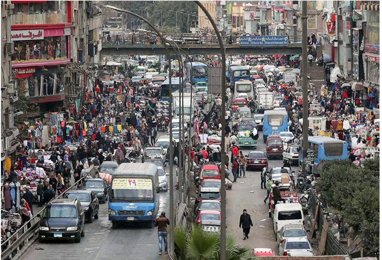
Figura 3. Congestión en El Cairo.

La lucha de Egipto contra la situación arquitectónica de su milenaria capital no es nueva. Así, han sido numerosos los proyectos de construcción de núcleos metropolitanos con el objetivo de descongestionar El Cairo. Durante el siglo pasado comenzaron a surgir ciudades como 10th Ramadan City, 6th October City, Sheikh Zayed City, o Nuevo Cairo. Estos nuevos centros urbanos nacieron con la vocación de ser zonas metropolitanas autónomas, con el desarrollo de economías locales, y buscando atraer inversores internacionales —contando con la creación de colegios y universidades internacionales, por ejemplo—. Pero sin duda, la construcción de la nueva capital administrativa supera todos estos proyectos. A pesar de ser ya conceptualizada en los años setenta del pasado siglo, no fue hasta el año 2013, después de la llegada al poder de Abdel Fattah Al-Sisi, cuando el proyecto fue aprobado y se puso en marcha.