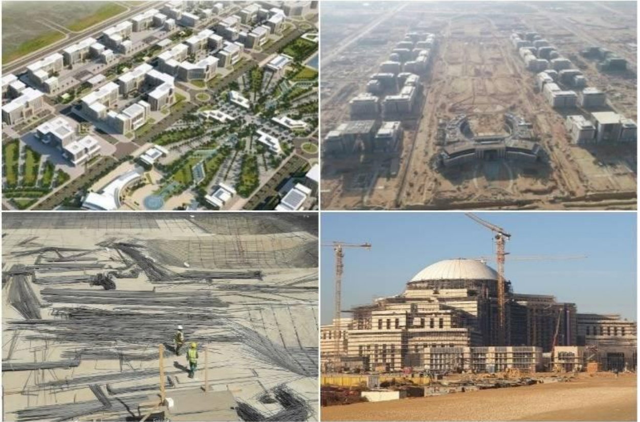
Figura 4. Construcción de la nueva capital administrativa de Egipto.