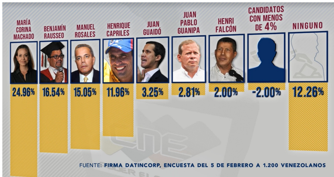
Figura 2. Candidatos opositores a las elecciones primarias en Venezuela Fuente: OCANDO ALEX, Gustav. «Una exdiputada y un comediante parten como favoritos en primaria opositora en Venezuela». Voz de América , 20 de febrero de 2019. Disponible en: https://www.vozdeamerica.com/a/exdiputada-y-comediante-parten-como-favoritos-primaria-opositora-venezuela/6967586.html [consulta: 2/4/2023].

su deriva inoperante 50 . Este, asimismo, no dudó en señalar al resto de los partidos de la Plataforma Unitaria por poner en riesgo esos activos venezolanos en el extranjero que venían gestionando hasta el momento 51 .