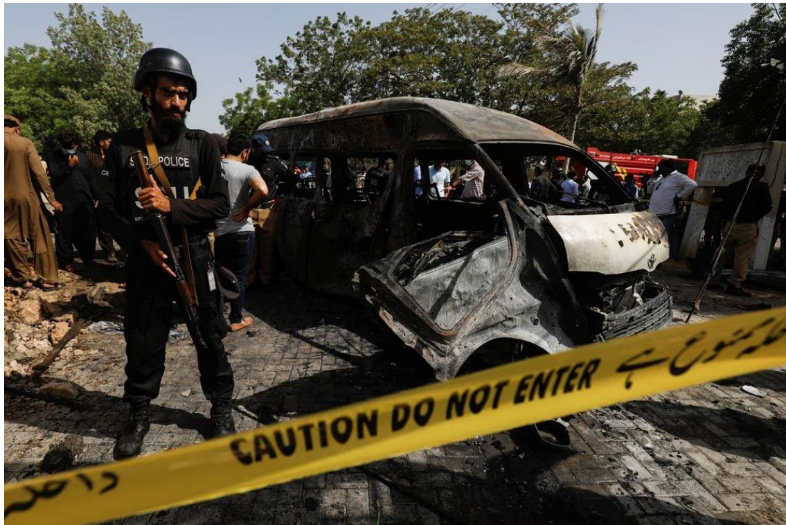
Fig. 6. Imagen del minibus en el que viajaban los profesores chinos en Karachi.

mujer suicida del ELB tenía como indudable destinatario al Gobierno chino ya que fue doblemente dirigido contra ciudadanos de ese país como contra un elemento del «poder blando» de Pekín: el Instituto Confucio 46 de Karachi. El 26 de abril de 2022, en las cercanías de esas instalaciones la atacante detonó su carga explosiva provocando la muerte de tres profesores del Instituto Confucio de nacionalidad china que viajaban en un minibus, así como la de un ciudadano pakistaní 47 .