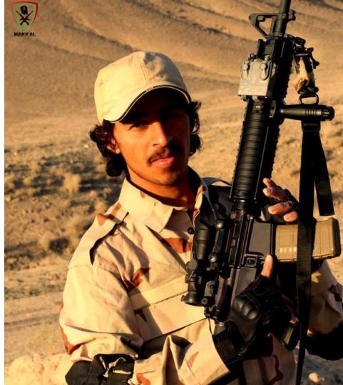
Fig. 3. Imagen de un integrante del ELB con un fusil de asalto M16 de fabricación estadounidense.

Tras tomar el poder, los talibanes afganos también se hicieron con el control de ingentes cantidades de equipo y armamento. Ello trajo como derivada que material que se entregó originalmente a las fuerzas de seguridad afganas bajo un programa de capacitación y asistencia por parte de EE. UU., como fusiles de asalto, pistolas, granadas o equipos de visión nocturna, acabasen en manos de «comerciantes» afganos que tienen en su «cartera de clientes» a sus homólogos pakistaníes. Así, el mulá Mullah Basir Akhund, ex comandante talibán residente en Kandahar, detalló a The New York Times en 2021 como puso en contacto a un «comerciante» de Kandahar con otro pakistaní demandando este último, fusiles, munición, armas cortas, equipos de visión nocturna y otros materiales militares de producción estadounidense 32 .