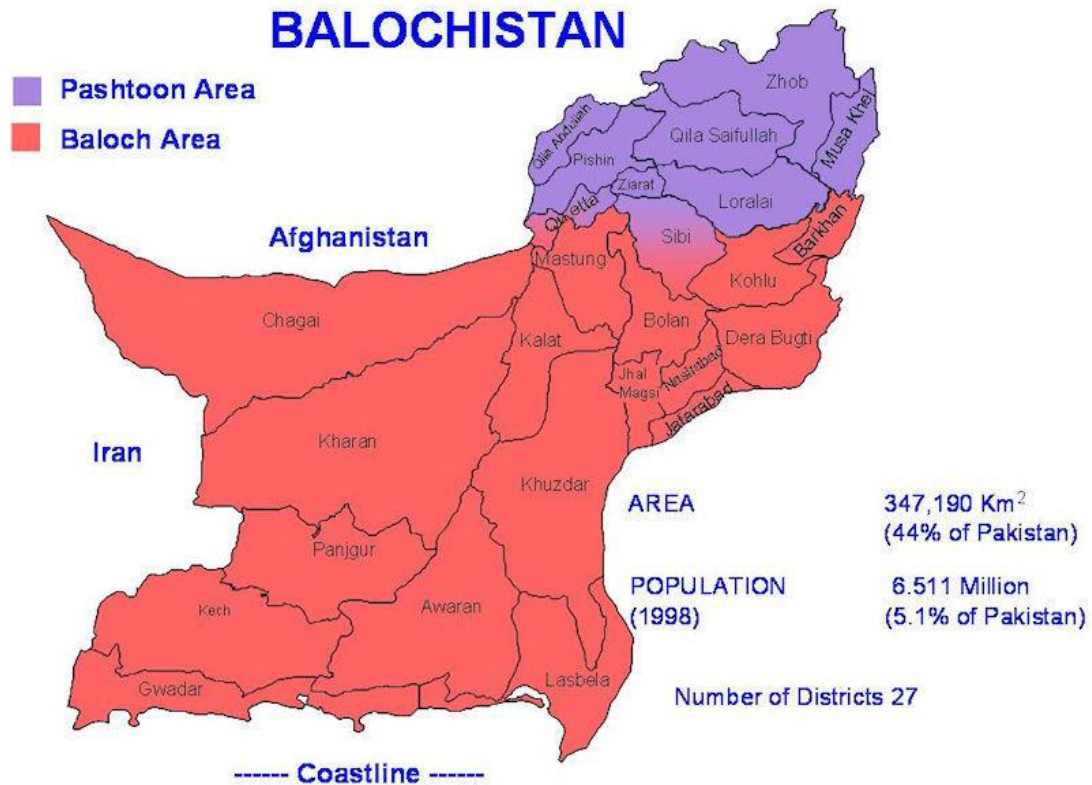
Fig. 1. Áreas de Baluchistán con predominio de las dos etnias mayoritarias (baluchi y pastún).

seguidos de la sindí, siendo las lenguas más habladas el baluchi, el pastún, el sindi y el brahui 6 .