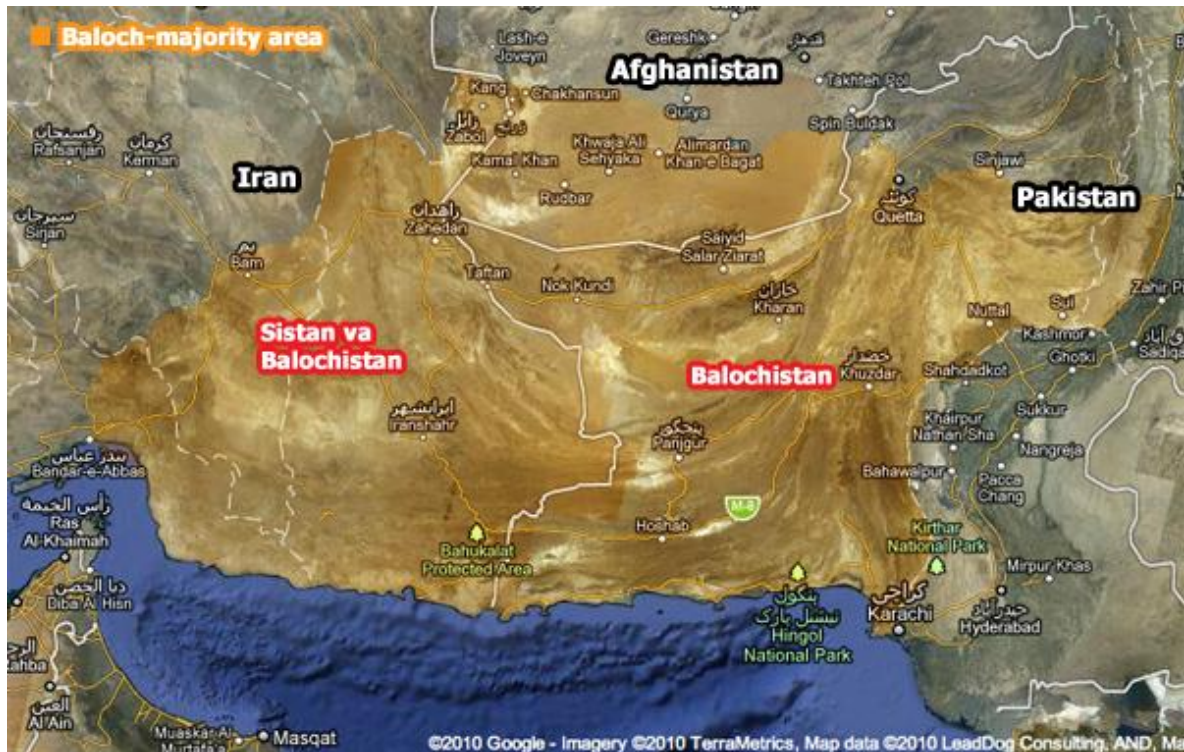
Fig. 2. Distribución del pueblo baluchi en Pakistán, Afganistán e Irán.