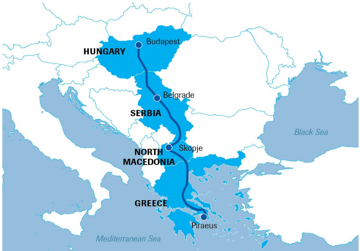
Mapa de la Ruta Express Tierra-Mar china.

como ya ha pasado en Montenegro 7 . El total de inversiones chinas entre 2009-2021 se elevó a 32.000 millones de euros 8 , fundamentalmente dedicados a infraestructuras que, a su vez, suelen ir acompañadas de violaciones de derechos laborales y daños medioambientales. Esto perjudica directamente las posibilidades de integración en la UE, debido a que supone un alejamiento de los estándares que la Unión exige en dichos sectores. Además, los contratos con empresas chinas no se hacen públicos, careciendo de transparencia y así, facilitando la corrupción.