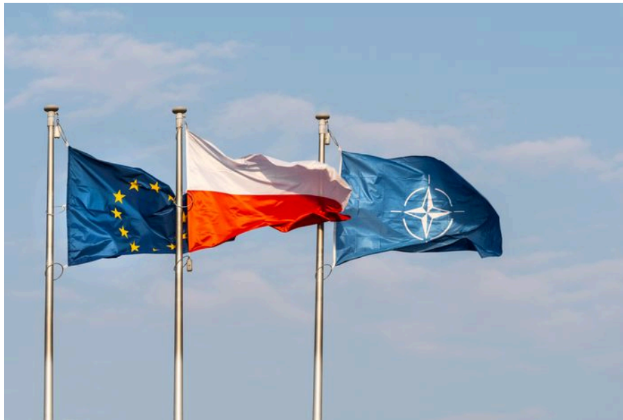
Figura 1. Símbolo de la participación Polaca en la UE y en la OTAN.

histórico que la envuelve han marcado la perspectiva polaca en cuanto a la voluntad de integración en cuestiones de defensa y seguridad en la UE y la OTAN.