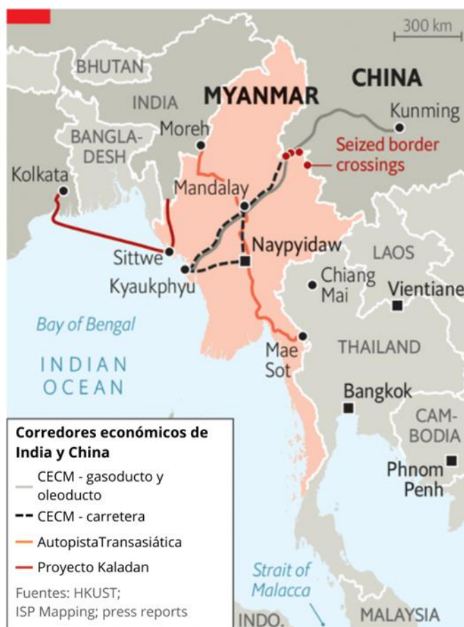
Figura 2. Proyectos de inversión desarrollados en Myanmar, en naranja se representa la autopista Transasiática; en rojo el Proyecto Multimodal de Kaladan; y en negro los proyectos chinos (CECM).

Actualmente, entre el 75 y el 80 % de la energía que importa China llega desde Oriente Medio a través del estrecho de Malaca y el mar de la China Meridional 34 . Por tanto, partiendo de la antigua carretera de Birmania, ve en Myanmar un acceso al océano Índico que, no solo le permitiría establecer una ruta comercial desde su provincia interior menos desarrollada, Yunnan, sino también, contrarrestar con una vía alternativa la vulnerabilidad que supone la dependencia en el estrecho para sus operaciones marítimas internacionales y para su seguridad energética 35 . La persecución de este objetivo se ha traducido en el Corredor Económico China-Myanmar (CECM), una serie de proyectos de inversión y desarrollo de infraestructuras enmarcados dentro de la Belt and Road Initiative (BRI) su iniciativa más ambiciosa para ganar presencia global.